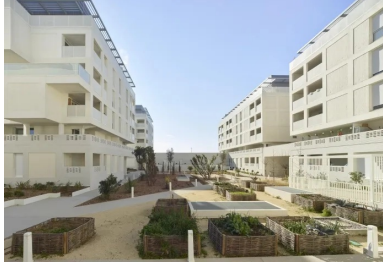
L'intérieur de l'îlot aménagé en cour-jardin est un espace de circulation et de convivialité, commun à la résidence.

La résidence Cosmopoly est située dans le nouveau quartier Euréka, au sud-ouest de Castelnau-Le-Lez, une commune de Montpellier Méditerranée Métropole. Créé dans le cadre d'une zone d'aménagement concerté (ZAC), le site traversé par le ruisseau de la Lironde était constitué de friches agricoles et d'espaces boisés. Son urbanisation était l'occasion de définir une limite claire avec la campagne et d'aménager une nouvelle entrée de ville, avec un programme de logements, bureaux, commerces, activités mais aussi des services nouveaux dédiés à une population senior. En outre, il intègre la renaturation de la Lironde et la restauration de continuités écologiques favorisant le déplacement d'espèces et la résilience des écosystèmes. Sur les 39 ha que compte le ZAC, 11 ha sont réservés à un espace naturel.