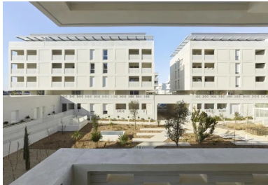
Vue depuis une loggia. Le garde-corps ajouré en briques de béton préserve des regards extérieurs.

La résidence Cosmopoly est située dans le nouveau quartier Euréka, au sud-ouest de Castelnau-Le-Lez, une commune de Montpellier Méditerranée Métropole. Créé dans le cadre d'une zone d'aménagement concerté (ZAC), le site traversé par le ruisseau de la Lironde était constitué de friches agricoles et d'espaces boisés. Son urbanisation était l'occasion de définir une limite claire avec la campagne et d'aménager une nouvelle entrée de ville, avec un programme de logements, bureaux, commerces, activités mais aussi des services nouveaux dédiés à une population senior. En outre, il intègre la renaturation de la Lironde et la restauration de continuités écologiques favorisant le déplacement d'espèces et la résilience des écosystèmes. Sur les 39 ha que compte le ZAC, 11 ha sont réservés à un espace naturel.