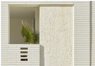
Association de pan de béton froissé et de briques de béton qui caractérise le socle de la résidence.