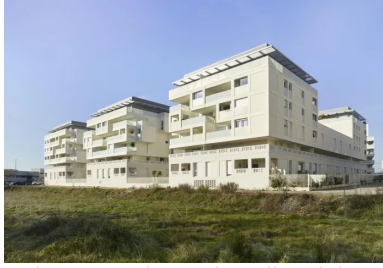
Unifiée par ses façades de béton blanc, la résidence s'élève sur 2 à 5 étages suivant les orientations.

Matricé, texturé, lisse, le béton blanc caractérise la résidence Cosmopoly qui, à travers sa cour-jardin, offre une continuité entre le parc et le nouvel écoquartier Euréka.