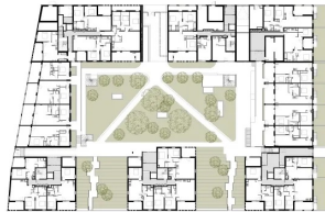
Plan du rez-de-chaussée.

Revendiquant une architecture sobre s'inscrivant dans un contexte paysager, les architectes ont opté pour une trame régulatrice qui ordonne les pleins et les vides, génère différentes profondeurs de façade : évidées au niveau de loggias, percée par les fenêtres et porte-fenêtres, remplies par des panneaux texturés. À cette modénature s'ajoute le traitement différencié des niveaux. Le socle est traité en briques de béton blanc, soit en pans pleins de béton matricé, soit en moucharabieh de grande taille pour la partie supérieure des garde-corps. Pour les volumes supérieurs, le béton banché blanc est associé à des éléments de remplissage en serrurerie perforées et thermolaqués blancs. Les parties pleines en béton sont également matricées. En retrait , le dernier étage est revêtu d'un bardage en aluminium et protégé par des ombrières. « Nous avons mis en fond de moule une matrice qui permet de donner un aspect froissé au béton » précise l'architecte, ajoutant que « toute la structure — voiles et planchers en béton — a été coulée en place. » Des rupteurs de pont thermique et une isolation par l'intérieur assurent la conformité à la RT 2012, la résidence étant par ailleurs reliée au réseau de chaleur urbain. Le béton blanc en façade faisait partie du cahier des charges élaboré par l'architecte-urbaniste coordinateur de la ZAC, Emmanuel Nebout. Sa teinte se rapproche de celle des pierres locales et son traitement brut assure une finition de qualité et pérenne.