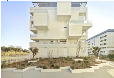
Pièce de vie ou loggia, les volumes en béton qui émergent de la façade offrent des situations singulières sur l'environnement.