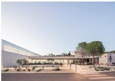
Le béton brut de décoffrage donne une unité à l'ensemble du bâtiment qui se déploie en U autour de l'esplanade.

Imaginé par Panorama Architecture, le pôle sportif universitaire, par sa géométrie simple et sa matérialité sobre affirmées par le béton, trouve sa place dans l'histoire du fort.