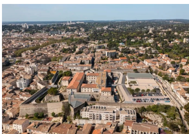
Vue aérienne qui permet de deviner l'emprise initiale du fort et son extension, au nord, dans laquelle prend place le pôle sportif universitaire.

Dans le nord de la ville, l'ancien fort de Nîmes construit à la fin du XVII e siècle sur un coteau, devenu lieu d'incarcération au XVIII e siècle et jusque dans les années 1990, a été transformé ensuite pour accueillir l'université de Nîmes. Suivant l'intervention de l'architecte Andrea Bruno, les bâtiments et services de l'université se répartissent à l'intérieur de l'enceinte de la citadelle, y compris dans les douves. Restait une réserve foncière disponible, la partie nord de la parcelle construite en extension de la citadelle d'origine, dont les bâtiments d'incarcération ont été démolis et remplacés par une pinède.