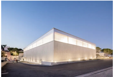
Volume simple et épuré mis en valeur par le béton de ciment clair.