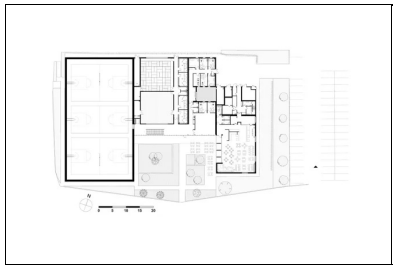
Plan du rez-de-chaussée.