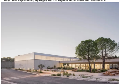
Minéral et lumineux, le bâtiment s'ouvre en façade sud, protégée du soleil et des intempéries par l'avant que forme l'avancée de la toiture.