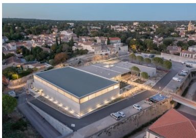
Relié au reste du fort par la passerelle (à droite), le pôle sportif universitaire avec son esplanade paysagée est un espace fédérateur de l'université.

C'est sur cette parcelle en pente, bordée par des voiries au sud et l'ouest et d'un parking à l'est, que prend place le nouveau pôle universitaire sportif livré en 2021 après 16 mois de chantier. Par respect pour l'histoire du lieu, son emprise préserve l'emplacement de l'ancien bastion nord et la trace archéologique du premier mur d'enceinte restés enfouis.