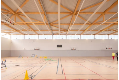
La lumière naturelle et le choix d'une palette de teintes claire, au sol comme sur les murs, apportent une impression de légèreté au volume de la salle multisport.