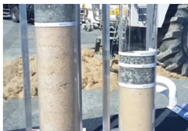
Photo 1 : éprouvettes avec la différence d'épaisseur de structure entre matériaux granulaires et couche de forme traitée (c) CIMBéton

Le traitement des sols en couche de forme ou assise de chaussées et le retraitement en place des chaussées « fatiguées » permettent historiquement des gains économiques et environnementaux jusque 30 à 50 %, en économie de ressources naturelles et de fait en transports de matériaux destinés au chantier (impacts CO 2 , économique, usure des réseaux voisins, fluidité du trafic et sécurité des usagers). A l'avenir, optimiser le niveau de portance et les performances des plateformes ou assises de chaussées, en ciblant des performances PF3 ou PF4 (d'après le Guide des Traitements de Sols), permet d'envisager une meilleure pérennité des ouvrages, notamment au regard des épisodes climatiques atypiques (sécheresse, inondation) mais également une diminution des épaisseurs de matériaux nobles de la chaussée et donc des gains économiques et environnementaux encore plus conséquents.