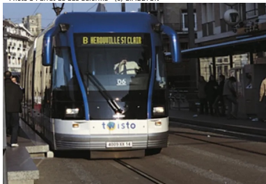
Photo 4 : arrêt et voie de tram ombrières, en cours d'usure avancée