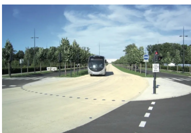
Photo 5 : Plate-forme en béton pour Bus à Haut Niveau de Service BHNS, Melun-Sénart

Les solutions d'aménagement urbain et routier en béton apportent une réponse durable face aux sollicitations toujours plus nombreuses. Grâce à leurs propriétés esthétiques, ces solutions peuvent également concourir à une signalisation et un partage améliorés de la chaussée, tout en réduisant les îlots de chaleur grâce à leurs caractéristiques photométriques (effet albédo notamment).