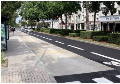
Photo 6 : Chaussée renforcée en béton à un arrêt de bus à Angers/Transbus.org