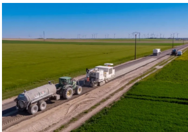
Photo 2 : chantier de retraitement des chaussées en place à froid aux liants hydrauliques routiers