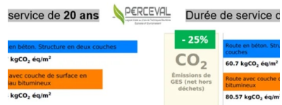
Illustration 1 : Perceval - Comparaison indicateur CO 2 entre structure bitumineuse et structure béton avec intégration de l'entretien sur 20 et sur 40 ans

raison PERCEVAL structure béton / structure bitum - Plate-forme support PF3 - 21cm BC5 / 11cm GB 1 : régénération surface tous les 7 ans és bitumineux : roulement tous les 5 ans, structure 1