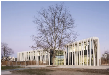
La façade côté parc s'incurve légèrement pour marquer l'entrée et ménager un large parvis d'accueil.

Conçu comme un pôle culturel et social, le bâtiment regroupe les fonctions de médiathèque et de maison de quartier. Il répond à de multiples besoins avec pour ambition de donner l'envie d'apprendre, de pouvoir exercer ses compétences ou d'en acquérir de nouvelles. Dès l'origine du projet, et à chaque étape de sa réalisation, la ville a suivi une démarche de coconstruction pour identifier et prendre en compte les besoins des Vaudais. Cela explique la densité du programme réparti sur 2 500 m 2 , avec, entre autres, des espaces de lecture et de diffusion culturelle, une cuisine, un café social, un studio de danse, une ludothèque, une salle de spectacle ou un « FabLab ».