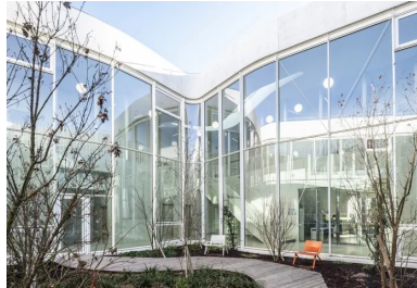
Pivot central du projet, le large patio végétalisé est ouvert à tous par beau temps.