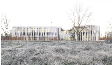
Enveloppée de colonnes de béton blanc, aussi sobres qu'originales, la médiathèque s'inscrit avec élégance dans un environnement en devenir.

Avec son exostructure de béton blanc, l'Atelier Léonard de Vinci s'inscrit dans un quartier à recréer pour y jouer le rôle de catalyseur social et urbain.