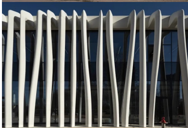
L'inclinaison des poteaux de l'exostructure varie pour créer un rideau ondulant.