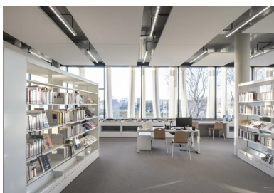
Les poteaux de l'exostructure protègent sans briser les vues sur l'extérieur.

Emblématique des grands ensembles d'habitat social et marquée par les émeutes de 1979 puis celles de 1990, la commune de Vaulx-en-Velin symbolisait le malaise des banlieues. Affublée d'une étiquette « zone à éviter », elle fut le déclencheur d'un renouveau de la politique urbaine. La ville s'est reconstruite peu à peu au gré des dispositifs mis en place pour désenclaver, requalifier, donner un nouveau souffle et une attractivité à ces ensembles laissés trop longtemps de côté. Le quartier du Mas du Taureau bénéficie enfin de l'un de ces plans. La nouvelle médiathèque, qui fait également fonction de maison de quartier, est le premier pilier de ce renouvellement urbain, comme l'exprime parfaitement Rudy Ricciotti, l'architecte des lieux : « Entre un hier à oublier et un horizon plein de promesses, la maison de quartier de Vaulx-en-Velin doit jouer son rôle de catalyseur, vaisseau amiral d'une vaste opération de transformation. » Et si son projet a été plébiscité, c'est bien parce qu'il s'inscrit parfaitement dans le tracé du nouvel aménagement et dans l'esprit de cet équipement, à la fois innovant et populaire. Sa base carrée s'aligne sur toutes ses faces dans la trame de la future ZAC. Si son volume compact et orthogonormé fait écho aux constructions avoisinantes tant par son échelle que par sa forme, il se démarque par un design aussi sobre que singulier, permettant aux passants d'y reconnaître un bâtiment public.