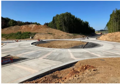
Vue du carrefour giratoire en béton en cours de finition.

Le département de la Seine-Maritime et la région Normandie viennent d'achever l'aménagement d'un carrefour giratoire au droit de l'échangeur entre la RD6015 et les RD926 et RD33, au lieu-dit du Poteau d'Allouville, sur la commune d'Allouville-Bellefosse. Cet aménagement sécurisera tous les déplacements des usagers de ce carrefour complexe et confortera la desserte du territoire.