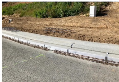
Les chainages ont été mis en place pour renforcer les bords de dalles sollicités ainsi qu'au droit des joints de dilatation.