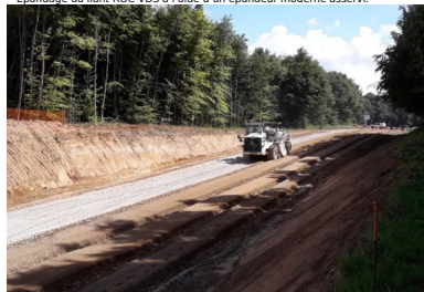
Malaxage du liant avec le matériau de la couche de forme à l'aide d'un pulvimixeur moderne.