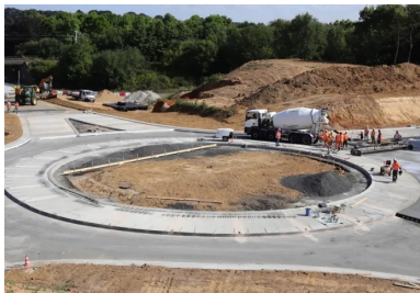
Bétonnage de l'anneau extérieur du carrefour giratoire.

« Nous n'avons pas eu besoin d'utiliser du très gros matériel : la règle vibrante classique et l'aiguille vibrante se sont révélées une bonne méthode. Le savoir-faire de nos hommes a permis le reste. Le nivellement et la planéité ont été parfaitement assurés, l'écoulement des eaux s'effectuant sur les exutoires », ajoute Quentin Hognon.