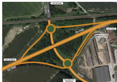
Un double carrefour giratoire au pied de l'échangeur.