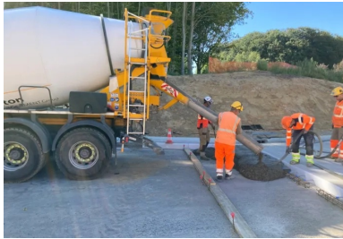
Réalisation de la dalle de transition.

D'une longueur totale de 1,30 m, ces dalles de transition ont chacune une épaisseur qui décroît de 19 à 10 cm pour former un talon. Destinées à être recouvertes par une couche bitumineuse, comme le prolongement de la chaussée, elles assurent un raccordement robuste qui transfère progressivement les efforts exercés par les poids lourds. Cela réduit ainsi les risques de déformation de l'enrobé en limite de béton, laquelle conduirait à l'apparition d'une marche et d'épaufures.