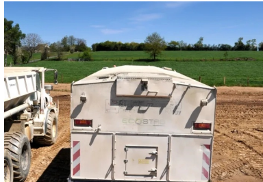
Épandage du liant ROC VDS à l'aide d'un épandeur moderne asservi.

Le matériau a été ensuite remis en forme à l'aide d'une niveleuse. Deux types de compacteurs se sont chargés du matériau traité afin d'atteindre l'objectif q3 fixé : un compacteur monocylindre à bille lisse Dynapac CA402 (pour bien compacter en fond de couche) puis compacteur à pneus Lebrero CNL 824 (pour donner un bel uni). Une niveleuse assistée par GPS a effectué le réglage par recoupe de la couche traitée pour obtenir un résultat au centimètre près. On parvient ainsi à un très bon uni et à un profil en long très régulier.