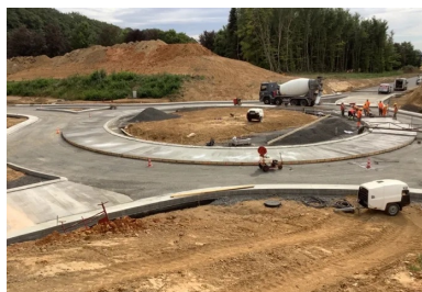
Bétonnage de l'anneau intérieur du carrefour giratoire.

Livré à l'avant de la règle vibrante, le béton a été mis en forme et vibré en une seule opération, sur une épaisseur de 19 cm. « Une fois le béton déversé, nous l'avons travaillé par vibration externe à la règle vibrante pour bien le fermer et assurer ainsi la résistance et la classe d'exposition », précise encore Quentin Hognon. Il n'a été fait que très peu de vibrations internes à l'aiguille vibrante, sauf dans les endroits difficiles, comme les pieds de coffrage. Si l'on penvibre trop avec une formule de consistance S3, le risque est de provoquer la ségrégation du béton.