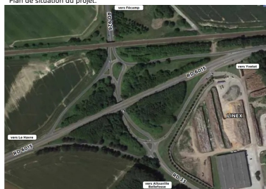
Vue aérienne du carrefour actuel.