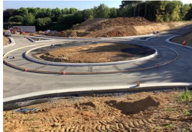
Réalisation du coffrage de l'anneau interne entre la bordure béton qui sert aussi de coffrage et le coffrage bois. Les paniers de goujons sont positionnés et fixés dans la grave-bitume.

L'entreprise a mis en place, au droit de chaque joint de retrait transversal et de chaque joint de dilatation , un système de transfert de charge : celui-ci est constitué de goujons de 25 mm de diamètre et de 45 cm de longueur. Ils sont positionnés à mi-hauteur du revêtement en béton et à cheval sur le joint, à l'aide de paniers, à raison d'un goujon tous les 30 cm.