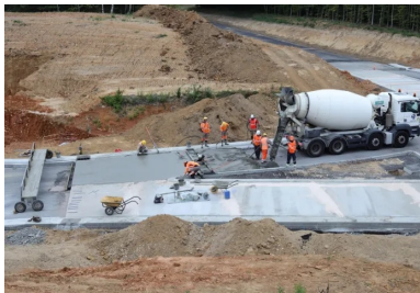
Contrôle de la consistance du béton à l'aide de l'essai d'affaissement au cône d'Abrams.