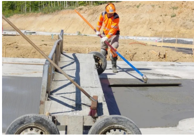
Talochage de la surface du béton.

Immédiatement après le bétonnage, les opérations manuelles de talochage et de lissage ont été réalisées par des équipes de maçons experts pour conférer au revêtement en béton un état de surface plan et d'aspect fermé (exempt de cavités ou de trous).