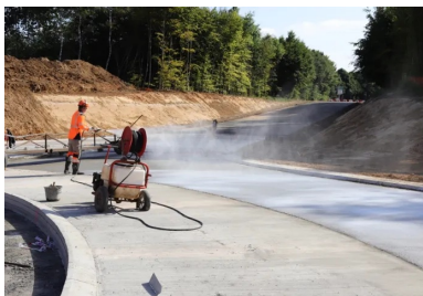
Pulvérisation d'un produit de cure à la surface du béton.

L'opération de balayage a été immédiatement suivie de la protection du béton, réalisée en pulvérisant manuellement à la surface du revêtement un produit de cure, à raison de 200 g/m 2 (au minimum).