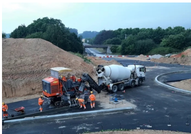
Après la mise en œuvre de la grave-bitume, une machine à coffrage glissant a réalisé les bordures et les bordures-caniveaux.

Une machine à coffrages glissants a été employée pour réaliser la bordure intérieure, puis la bordure-caniveau extérieure du carrefour giratoire. « Leur altimétrie est parfaitement contrôlée, ce qui permet de les utiliser comme guides pour le coulage du revêtement en béton. Elles servent également de coffrage, d'où un gain de temps non négligeable », signale Quentin Hognon, conducteur de travaux de l'agence Grands Travaux de Colas.