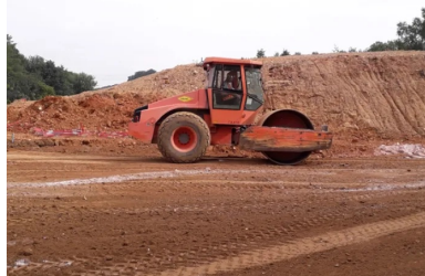
Compactage de la couche de forme.