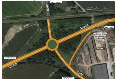
Un carrefour giratoire au droit de l'échangeur.

La comparaison des deux solutions, selon différents critères, a conduit le Département à retenir celle d'un giratoire central à l'emplacement du passage supérieur de la RD6015 sur la RD926.