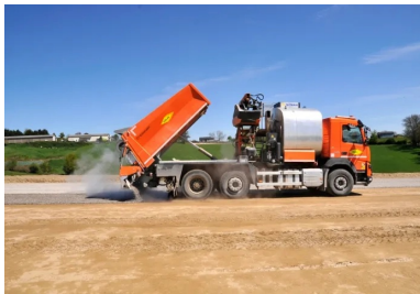
Protection de la couche de forme.