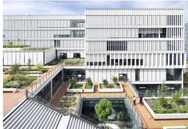
Le cœur d'îlot est animé de patios qui permettent d'assurer l'éclairage naturel d'un maximum de locaux.

Les architectes ont fondé le parti de leur réponse architecturale sur les volontés environnementales ex-primées dans le cahier des charges du nouveau quartier avec la mise en œuvre d'une véritable mixité associant plusieurs usages urbains habituellement séparés dans les villes actuelles ; à savoir : habiter, apprendre, entreprendre.