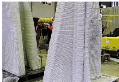
Des coques en béton imprimées 3D par dépôt de couches successives sont apposées sur la structure en béton armé pour servir de coffrage.

Le lot 4 concerne la conception et l'immersion d'un « village » de récifs artificiels. Composé d'enrochements et de plusieurs types de récifs secondaires disposés autour d'un module principal haut de trois étages, il s'étend sur plus de 1 000 m à 20 m de profondeur. L'ensemble sert à protéger l'habitat marin coralligène en déportant une partie de l'activité de plongée.