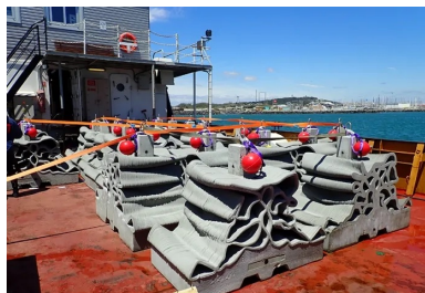
Trente-quatre lests de balisage Xreef ont été immergés pour former un corridor écologique.

La conception et la réalisation du récif central ont fait l'objet d'un long travail itératif afin de répondre à trois impératifs : satisfaire les attentes des clubs de plongée, être attractif pour la biodiversité marine et réunir les conditions nécessaires en termes de dimensionnements hydrodynamiques, structurels et mécaniques lors des phases de manutention, d'immersion puis de tenue en mer. Seaboost et ses partenaires ont opté pour une solution innovante associant une superstructure en béton armé couplée avec des coques en béton imprimées 3D en atelier. L'ensemble des bétons utilisés, structure et 3D, présente une rugosité, une porosité et un pH de surface favorables à la colonisation en milieu marin.