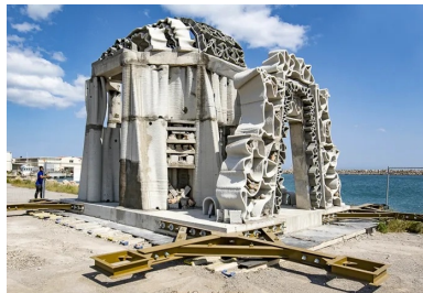
Au cœur du village de récifs artificiels, le module central mesure 6,50 m de haut sur une base de 48 m 2 .

Ecole centrale de Marseille a contribué aux études en bassin à houle pour déterminer les dimensions des modules les mieux adaptées aux conditions hydrodynamiques du site. Les lests conçus par Seaboost ont été réalisés à « l'encre 3D béton » de Vicat grâce à la technologie d'impression 3D d'XtreeE. Fabriqués à Paris, transportés à La Seyne-sur-Mer, acheminés par navire jusqu'au Cap d'Agde, les Xreef ont été immergés fin mai 2019 par l'entreprise Foselev Marine. L'ampleur du déploiement est une première mondiale, qui permet de créer un corridor écologique pérenne tout en optimisant, à moyen terme, les coûts de gestion et le bilan carbone du balisage en mer.