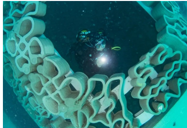
Outre ses vertus écologiques, le design de ce gigantesque récif artificiel répond aussi aux attentes des clubs de plongée.