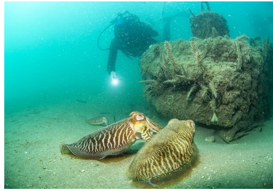
Très vite, ils ont servi de support à la flore et accueilli des œufs de calmars.

L'immersion de 34 récifs en béton réalisés en 3D n'est là que l'une des quatre opérations du projet Récif'lab porté par la ville d'Agde et mis en œuvre par l'entreprise montpelliéraine Seaboost. Lauréat en 2018 d'un programme d'investissement d'avenir, Récif'lab vise un objectif très concret : protéger et reconquérir la biodiversité marine endémique par une approche innovante.