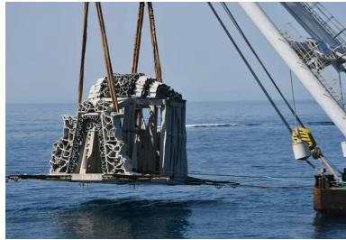
Immersion du module central au large de l'île de Brescou.