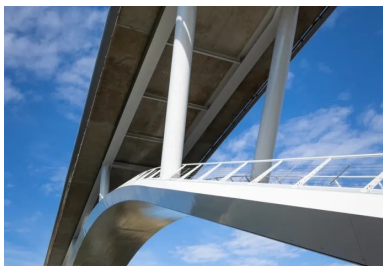
Soutenant le tablier mixte acier-béton par l'intermédiaire de pilettes disposées en « éventail », l'arc est constitué de deux segments rectilignes reliés au centre par un arc de cercle tangent.

Créé pour désengorger le centre-ville et favoriser les mobilités douces, le contournement routier nord de Château-Gontier-sur-Mayenne (53) intègre sur son tracé de 4,1 km deux ouvrages d'art, destinés à franchir les vallées du Bouillon et de la Mayenne. En 2015, le Conseil départemental de la Mayenne, maître d'ouvrage du contournement, lance un concours de maîtrise d'œuvre pour les concevoir. C'est le groupement associatif l'ingénieur SCE et le cabinet d'architecture A.O.A. - Thomas Lavigne qui remporte la compétition en proposant, pour l'ouvrage de franchissement de la Mayenne notamment, une conception audacieuse. « Nous nous sommes vite rendus compte que les caractéristiques du programme – tablier à 28 mètres de hauteur, franchissement de la rivière sur 120 mètres en une seule portée, bonne tenue mécanique des sols – nous permettaient de concevoir un pont à arc inférieur plutôt qu'un classique pont à piles », décrit l'architecte Thomas Lavigne.