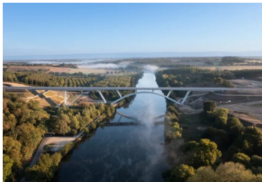
Situé à quinze minutes à pied du centre-ville de Château-Gontier, le viaduc de la Mayenne est l'ouvrage majeur du contournement routier nord de la sous-préfecture de la Mayenne. Son arc structurel de 122 mètres de portée enjambe majestueusement la rivière.

Traversant majestueusement la vallée de la Mayenne, le nouveau viaduc en arc du contournement routier nord de Château-Gontier (53) se distingue par sa finesse et son élégance structurelles. Mais l'ouvrage d'art se singularise aussi par l'usage qui en est fait. Son arc est en effet conçu comme une passerelle piétonne franchissant la rivière. Ce caractère unique a posé de nombreux défis techniques tant à ses concepteurs qu'à ses constructeurs.