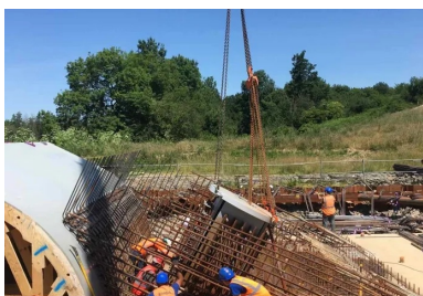
Amorce de pied d'arc en cours de réalisation. La précision de positionnement des différentes parties de l'ouvrage constituait l'un des défis techniques du chantier pour NGE GC. Ainsi, les inserts métalliques noyés du pied d'arc (platinas d'appareils d'appuis et pièces d'ancrage) sont positionnés avec une précision de + ou - 3 millimètres.

Cette optimisation de la matière se retrouve également au niveau de l'arc. Cœur esthétique et technique de l'ouvrage, celui-ci est constitué de caissons métalliques de 1,5 mètres d'épaisseur. Il est formé à ses naissances par des segments de droites inclinées – dont la pente a été réglée pour pouvoir intégrer des marches d'escalier conformes à la réglementation – reliés en son centre par un arc de cercle tangent. La largeur des caissons, de 4 mètres en pied, s'élargit progressivement pour atteindre 7 mètres à la clé, formant une confortable plateforme-belvédère en platelage bois. Les pilettes, soudées à l'arc, ne sont pas verticales mais dessinent un « éventail » pointant vers le centre de l'arc. « La forte inclinaison des pilettes extérieures prolonge la portée de l'arc au maximum, ce qui nous a permis de n'avoir qu'une seule pile verticale, sur la rive ouest », analyse l'architecte.