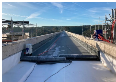
Étanchéité du tablier supérieur : les dalles en BFUP vont recouvrir la géomembrane pour la lester.

« Son objectif était de mettre en scène l'arrivée de l'eau sur le canal de Marseille au moyen d'ouvrages emblématiques. » À l'issue d'un chantier gigantesque mobilisant près de 5 000 ouvriers et 160 000 pierres de taille, l'aqueduc de Roquefavour est mis en service en 1847. Exploité par la Société Eau de Marseille Métropole (SEMM), il est aujourd'hui l'un des derniers aqueducs en activité et classé au patrimoine historique depuis 2005.