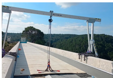
Les dalles manipulables sont posées à l'aide d'un portique roulant.