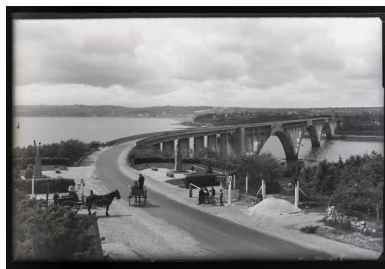
Jusqu'en 1994, année de mise en service du pont voisin de l'Iroise, le pont Albert-Louppe permettait la traversée des voitures automobiles...ou à cheval !