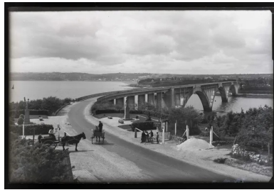
Jusqu'en 1994, année de mise en service du pont voisin de l'Iroise, le pont Albert-Loupe permettait la traversée des voitures automobiles...ou à cheval !