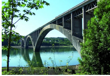
L'ouvrage, aujourd'hui toujours debout, est considéré comme un héritage somptueux de l'âge d'or du béton armé.

Bientôt centenaire, le pont Albert-Louppe avec ses trois arches en béton armé de 186 m de portée constitue un témoignage extraordinaire du génie de son concepteur, Eugène Freyssinet.