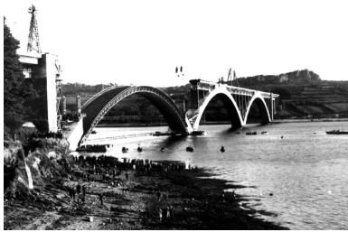
Reconstruction de l'une des arches, démolie pendant la seconde guerre mondiale, à l'aide d'un cintre similaire au cintre d'origine.

Une fois le cintre libéré, il était débridé et déplacé jusqu'à l'emplacement de l'arche suivante, où la même cinématique de pose était reproduite. Les trois arcs en place, restait alors à construire les pilettes intermédiaires et le double tablier – dont le tablier supérieur, encastré dans l'épaisseur des arcs à la clé, permettait d'abaisser le niveau de la chaussée d'environ 4 m, ce qui facilitait le raccordement en rive.