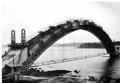
Bétonnage par plots du premier arc.

Eugène Freyssinet, concepteur du pont Albert-Louppe