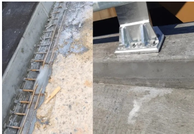
Joint de reprise des longrines. Les armatures (photo de gauche), placées au fond d'une saignée, permettent de connecter le BFUP de la longrine à celui du hourdis. Ce dispositif de couture permet de garantir, par l'intermédiaire d'un recouvrement des BFUP, la parfaite continuité de l'étanchéité (photo de droite).

La bonne réalisation de l'étanchéité BFUP sur l'ouvrage existant passait ainsi par un phasage précis. Tout d'abord, il s'agissait de raboter l'enrobé et l'étanchéité existants. A cette étape de curage succédait celle du surfacage du béton support par hydrodémolition. « L'objectif de cet atelier était de créer une macrorugosité optimale pour assurer l'adhérence à l'interface du BFUP et du béton. Il faut en effet noter que la connexion mécanique entre les deux matériaux n'était pas réalisée par l'intermédiaire de connecteurs, mais par une simple reprise de bétonnage », poursuit Benjamin Simian. Le support était ensuite humidifié à l'aide d'un brumisateur afin d'améliorer les conditions de prise et d'adhérence du BFUP, coulé en une couche de 3,5 cm d'épaisseur. Enfin, l'enrobé était mis en œuvre sur 5 cm d'épaisseur après hydrodécapage du BFUP et emploi d'un primaire pour améliorer l'adhérence du matériau bitumineux sur le BFUP.