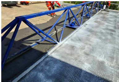
Coulage de la couche d'étanchéité BFUP du tablier. Une fois coulé sur le support béton humidifié, le BFUP est légèrement vibré à l'aide d'une règle vibrante. Cette opération permet d'étaler le matériau et de fixer son épaisseur selon une pente transversale de 2 %. Une fois mis en œuvre, le BFUP est immédiatement traité avec un produit de cure puis recouvert d'un géotextile. Celui-ci est maintenu humide pendant quatre jours, afin de garantir une prise homogène du BFUP.