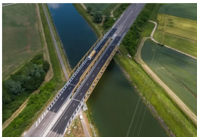
Vue aérienne du viaduc du canal de dérivation de la Saône rénové sur l'A36. L'ouvrage est constitué d'un double tablier mixte de 100 m de long à poutres extradossées de type Warren. Le chantier de réfection de l'étanchéité était soumis à deux contraintes d'exploitation : l'impossibilité de couper la circulation des véhicules sur l'autoroute et des péniches sur le canal.

Sur l'autoroute A36, la réfection de l'étanchéité du viaduc franchissant le canal de dérivation de la Saône a été réalisée en béton fibré à ultra hautes performances (BFUP). Ce matériau très technique, habituellement réservé à des applications structurales, a été préféré aux matériaux et procédés d'étanchéité classiques. Une analyse multicritère tenant compte des spécificités de conception de l'ouvrage et de son environnement a ainsi conduit APRR, exploitant de l'A36, à expérimenter cette solution, inédite en France.