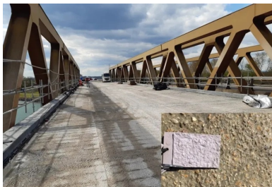
Préparation du support béton. La dalle béton support est soigneusement préparée par hydrodémolition avant le coulage du BFUP. Ce traitement assure une macro et une micro rugosité optimales pour que le BFUP puisse créer des liaisons chimiques suffisamment fortes avec le béton existant. Le niveau de rugosité est contrôlé visuellement à l'aide de petites plaques étalons (système ICRI) reproduisant la rugosité à atteindre (photo en bas à droite).

(2) Les trois normes BFUP françaises sont les normes NF P 18-451, NF P 18-470 et NF P 18-710