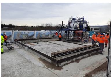
Dalle de convenance après hydrodémolition. Ce modèle réduit de la dalle du pont a été créé pour accompagner le bon déroulement du chantier. Pour valider les performances d'adhérence de l'étanchéité BFUP sur son support béton, des essais destructifs ont été réalisés sur cette dalle. Les résultats sont impressionnants : les éprouvettes ne cassaient pas à l'interface BFUP/béton, mais dans la masse du béton de dalle ! Autrement dit, la couche de BFUP crée un ensemble totalement monolithique avec la dalle existante.

« Forts de ce constat, nous avons alors décidé de reprendre l'intégralité de l'étanchéité de l'ouvrage », poursuit Romain Pittet. Plusieurs solutions ont alors été étudiées. « Nous avons mené une analyse multicritère rigoureuse sur la base des contraintes qui s'imposaient à nous et des objectifs que nous nous étions fixés. » Les contraintes principales étaient au nombre de trois : « Il fallait tout d'abord que nous n'augmentions pas le poids propre de l'ouvrage, sinon nous aurions été obligés de le renforcer. Cela signifiait notamment que nous devions conserver une faible épaisseur d'enrobés. Ensuite, nous devions trouver un procédé qui puisse résister durablement aux fortes chaleurs et à l'effet « radiateur » induit par la conception de l'ouvrage. Enfin, le chantier devait se dérouler dans un délai serré, pour minimiser la gêne à l'utilisateur. » Les objectifs principaux de la rénovation étaient quant à eux les suivants : « Nous voulions que la réfection soit pérenne dans le temps, pour que nous n'ayons pas à y revenir régulièrement. Pour garantir une protection uniforme sur toute la largeur de l'ouvrage, il fallait aussi que l'étanchéité couvre de manière continue le hourdis du tablier et les longrines latérales. »