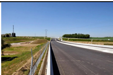
Traitement des loess et des lehms pour les travaux de terrassements du contournement ouest de Strasbourg