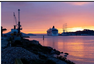
Du béton compacté routier (BCR) pour une plate-forme de stockage de véhicules en transit : le site CGMV du port de Brégaillon