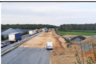
Traitement des sols pour les travaux de terrassement de l'A79, entre Toulon-sur-Allier et Digoin