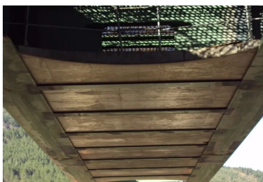
Prédalles participantes du hourdis inférieur - phase de lancement de la charpente. Mises en place avant le lancement, elles serviront de fond de coffrage lors du coulage du hourdis inférieur.

Classiquement sur ce type d'ouvrage, le tablier est constitué de deux poutres métalliques parallèles - généralement, des profils en « I » - régulièrement entrecroisées et surmontées d'une dalle supérieure en béton armé, à laquelle elles sont connectées par des « connecteurs » de type goujon. « Ces ouvrages sont très courants sur le réseau routier national non concédé », explique Clément Amourette. Au nombre de 630, ils constituent 15 % de la surface du patrimoine d'ouvrages d'art. « Les bipoutres mixtes, qui disposent d'un important corpus technique d'aides à la conception et d'un large retour d'expériences, ont connu un vrai engouement, notamment grâce à leur rapidité d'exécution via le procédé de lancement du tablier », poursuit Clément Amourette. Techniquement, ils allient deux matériaux très complémentaires, qui participent de concert à la reprise des efforts : l'excellente résistance du béton à la compression et la très grande ductilité de l'acier en traction sont mises à profit... « Mais la répartition des deux matériaux n'est pas optimale sur tout l'ouvrage », prévient Clément Amourette.