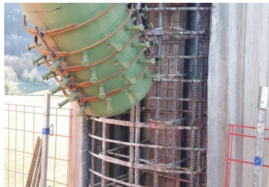
Clavage des entretoises des piles avec les fûts. Des réservations sont réalisées dans les fûts au droit de la jonction avec les extrémités des croix métalliques. Un ferrailage (non visible sur la photo) reliant les deux éléments est mis en place avant de couler le béton qui formera les bossages (visibles sur la photo n° 6).

« Ainsi transformé, le bipoutre mixte offre de nombreux avantages, affirme Clément Amourette. Les dalles de béton en semelles inférieures forment un entretoisement très rigide - le fonctionnement s'apparente alors dans ces zones à celui d'un tablier en caisson - qui annule le risque d'instabilité globale du tablier. » Le mécanisme de rupture de l'ouvrage mixte acier-béton est ainsi modifié : « On passe d'une ruine par instabilité géométrique à une ruine dite plastique, qui mobilise à plein la capacité de résistance des matériaux et redistribue les efforts dans la structure de manière optimale », précise l'expert du Cerema.