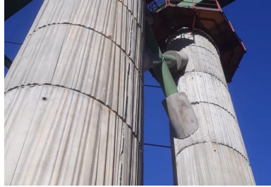
Pile en cours de construction. Les deux fûts sont entretoisés par une croix tubulaire métallique. Bien que reprenant des charges, cette croix répond d'abord à une finalité esthétique.

Logiquement, l'objectif est de placer des hourdis inférieurs en béton dans toutes les zones où ils seront comprimés et où les poutres métalliques sont susceptibles d'être soumises à des instabilités, soit entre 15 et 20 % de la longueur des travées de part et d'autre des piles.