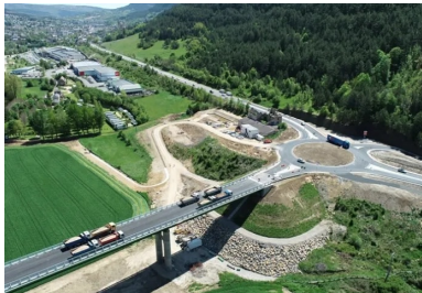
Vue aérienne de la culée CO. Le viaduc du Lot est l'ouvrage d'art principal de la future rocade ouest de Mende (en arrière-plan, le centre-ville).

À Mende (Lozère), le viaduc du Lot est le premier ouvrage routier à double action mixte de France. Cette technique, déjà employée sur des viaducs ferroviaires, est une déclinaison optimisée du tablier mixte acier-béton traditionnel. A la dalle supérieure vient s'ajouter une dalle inférieure en béton armé, située de part et d'autre de chacune des piles intermédiaires de l'ouvrage. Cette conception améliorée augmente la rigidité et la durabilité de l'ouvrage, pour un coût de construction équivalent à celui d'un tablier mixte acier-béton classique.