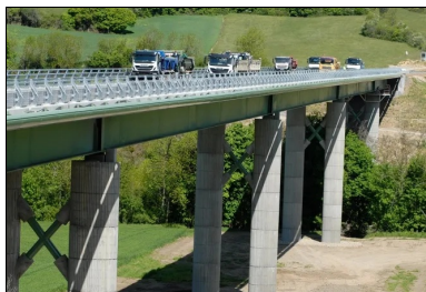
Épreuves de chargement du viaduc. Cette étape classique et obligatoire de la construction d'un ouvrage d'art consiste à vérifier que celui-ci est bien apte à assurer sa destination finale en termes de portance. Pour cela, un certain nombre de camions, dont le poids et la répartition sont calibrés, sont positionnés sur le tablier. Les flèches induites sur le tablier sont alors mesurées et comparées aux flèches théoriques attendues.