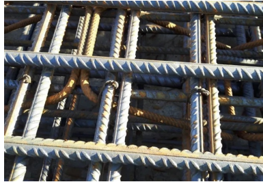
Ferrailage du hourdis inférieur. La densité d'armatures de cette dalle est très importante (environ 300 kg/m 3 , contre 250 kg/m 3 pour le hourdis supérieur).

Ce n'est ainsi qu'une fois le tablier en place sur ses appuis que le bétonnage du hourdis inférieur a pu être effectué, suivi immédiatement du bétonnage du hourdis supérieur par « pianotage », c'est-à-dire un coulage de la dalle par plots alternés, ce qui permettait à aussi de réduire les risques de fissuration.