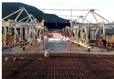
Bétonnage d'un plot du hourdis supérieur à l'aide d'un équipement mobile. Le bétonnage est réalisé par « pianotage », afin de répartir les charges de manière homogène.

Notifié en mars 2018, le marché de travaux comprenait une période préparatoire de 5 mois à laquelle s'ajoutaient 24 mois de travaux. Retardé par la crise sanitaire liée au Covid-19 et par les intempéries, le chantier a pu finalement être livré en juin 2021.