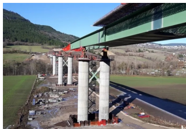
Lancement de la charpente. D'abord assemblé sur une plateforme installée sur l'une des deux culées de l'ouvrage, le tablier a été mis en place au cours de huit lancements successifs, muni d'une partie du ferrailage du hourdis supérieur ainsi que des prédalles et du ferrailage du hourdis inférieur.