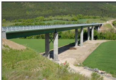
Vue d'ensemble du viaduc. Long de 323 mètres, le tablier de l'ouvrage s'appuie sur quatre doubles piles en béton armé, dont la plus haute atteint 22 mètres de hauteur.

Sur ces piles, dont la plus haute atteint 22 mètres de hauteur, s'appuie un tablier bipoutre mixte en acier et en béton armé d'un nouveau genre : il est dit « à double action mixte ». C'est le premier pont routier de ce type à être réalisé en France. Mais de quoi s'agit-il ? Pour le comprendre, il faut revenir aux fondamentaux : « Le bipoutre à double action mixte est d'abord un bipoutre mixte acier-béton », pose Clément Amourette, chargé d'affaires « Ouvrages d'art » au Cerema Méditerranée, concepteur de l'ouvrage.