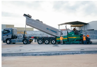
Un camion-benne, bâché durant le transport du BCR, déverse le matériau dans le finisseur. Celui-ci répand, nivelle et compacte le BCR.

Le BCR est ensuite acheminé depuis la centrale jusqu'au chantier, par camions à semi-benne. « Comme le BCR est très sensible aux variations de la teneur en eau, les camions sont équipés de bâches pour réduire l'évaporation de l'eau du matériau sous l'effet des conditions climatiques », ajoute Olivier Piselli.