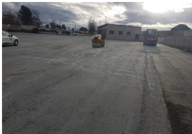
Compactage du BCR à l'aide de deux compacteurs vibrants VT2 et PV2.