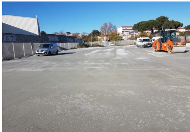
Le BCR acquiert rapidement une stabilité structurelle autorisant le stationnement des véhicules légers