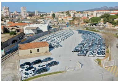
Vue aérienne de la plate-forme de stockage des véhicules en transit sur le Port de Brégaillon. (© Béton Vicat).

Vidéos, Guides techniques, organisation de Journées techniques, découvrez les outils mis à votre disposition sur : www.infociments.fr/routes/