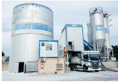
Centrale Béton VICAT où le BCR a été étudié pour optimiser sa formulation et fabriqué