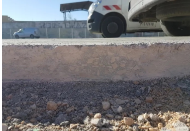
Pour la reprise de bétonnage, le joint de construction est scié proprement sur toute l'épaisseur de la couche de BCR puis humidifié. On voit bien la qualité de compactage (homogénéité et compacité) obtenue sur toute la hauteur de la couche.