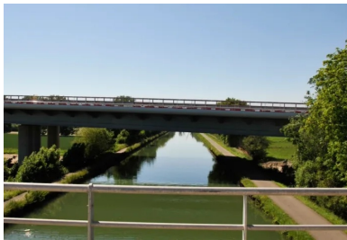
L'A355 se caractérise par une densité élevée d'ouvrages d'art. Ici un exemple de franchissement de canal.