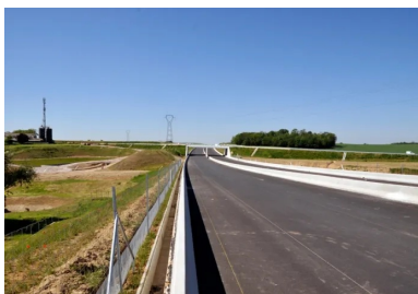
Vue d'ensemble d'un tronçon achevé du chantier du contournement de Strasbourg.

Le très vaste chantier du contournement ouest de Strasbourg (COS) met à l'honneur deux techniques : le traitement en place des sols, composés essentiellement de loess et de lehms, et l'utilisation des liants hydrauliques routiers (LHR) pour le traitement de la partie supérieure des terrassements et de la couche de forme. Un liant confectionné sur mesure pour un projet hors norme, dont les enjeux sont importants pour l'agglomération de Strasbourg.