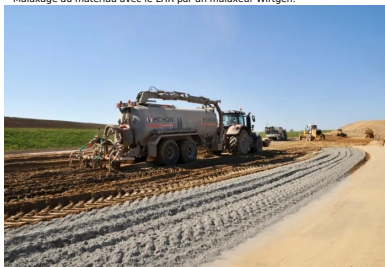
L'arroseuse à enfouissement garantit une teneur en eau optimale.