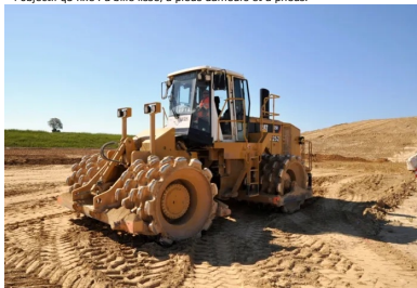
Trois types de compacteurs se sont chargés du compactage afin d'atteindre l'objectif q3 fixé : à bille lisse, à pieds dameurs et à pneus.