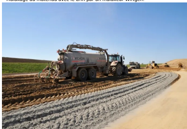
L'arroseuse à enfouissement garantit une teneur en eau optimale.