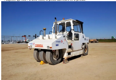
Trois types de compacteurs se sont chargés du compactage afin d'atteindre l'objectif q3 fixé : à bille lisse, à pieds dameurs et à pneus.