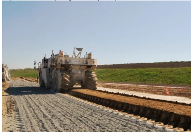
Malaxage du matériau avec le LHR par un malaxeur Wirtgen.