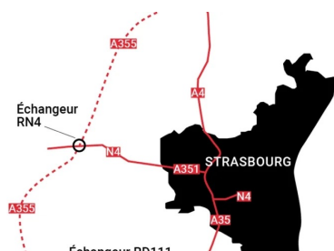
Plan de situation du réseau routier autour de Strasbourg pointant la nouvelle liaison A355.

Le projet de l'autoroute A355 et du contournement ouest de Strasbourg (COS), d'un montant de 553 M€, est financé grâce au concours de la Banque européenne d'investissement (BEI).