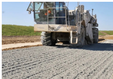
Un liant spécifique (ROC COS) a été développé par EQIOM en lien avec les équipes du projet, puis livré entre 2019 et 2021 en fonction des phasages du projet.