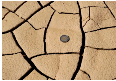
Forte sensibilité des matériaux loessiques : exemple d'une poche de matériau sec dans un dépôt après un épisode de forte chaleur.