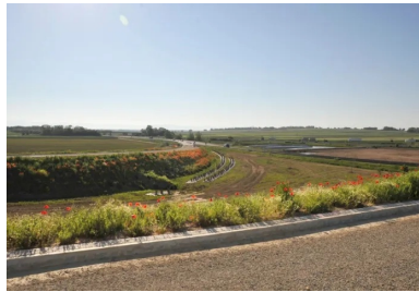
Les aménagements paysagers permettent d'intégrer la nouvelle route au paysage existant (ici une des bretelles d'accès).

Vidéos, Guides techniques, organisation de Journées techniques, découvrez les outils mis à votre disposition sur : www.infociments.fr/liants-hydrauliques-routiers/