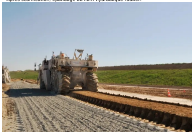
Malaxage du matériau avec le LHR par un malaxeur Wirtgen.