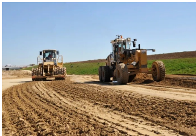
Compactage au Tamping SP2.