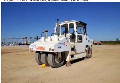
Trois types de compacteurs se sont chargés du compactage afin d'atteindre l'objectif q3 fixé : à bille lisse, à pieds dameurs et à pneus.