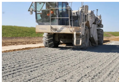
Un liant spécifique (ROC COS) a été développé par EQIOM en lien avec les équipes du projet, puis livré entre 2019 et 2021 en fonction des phasages du projet.