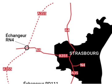
Plan de situation du réseau routier autour de Strasbourg pointant la nouvelle liaison A355.

Le projet de l'autoroute A355 et du contournement ouest de Strasbourg (COS), d'un montant de 553 M€, est financé grâce au concours de la Banque européenne d'investissement (BEI).