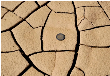
Forte sensibilité des matériaux loessiques : exemple d'une poche de matériau sec dans un dépôt après un épisode de forte chaleur.