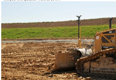
Préréglage à l'aide d'un bull asservi GPS afin d'obtenir une épaisseur homogène avant traitement.