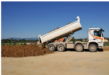
Acheminement des matériaux depuis le dépôt provisoire et mise en place sur site pour une épaisseur finale de 35 cm.

Un préréglage avec une niveleuse asservie GPS a été réalisé, de façon à obtenir une épaisseur homogène avant traitement. Cette phase est importante, car un bon réglage ne peut être garanti que s'il y a une recoupe de la couche après traitement.