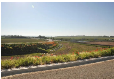
Les aménagements paysagers permettent d'intégrer la nouvelle route au paysage existant (ici une des bretelles d'accès).

Vidéos, Guides techniques, organisation de Journées techniques, découvrez les outils mis à votre disposition sur : www.infociments.fr/liants-hydrauliques-routiers/