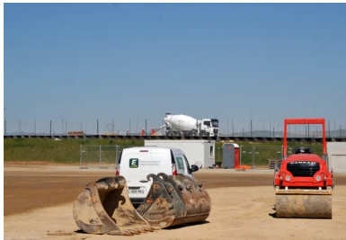
Trois types de compacteurs se sont chargés du compactage afin d'atteindre l'objectif q3 fixé : à bille lisse, à pieds dameurs et à pneus.

« Pour obtenir un résultat précis au centimètre près, une niveleuse assistée par guidage théodolite effectue le réglage par recoupe de la couche traitée. Ainsi on obtient un très bel uni et un profil en long très régulier », ajoute Romuald Chassagnol. Un enduit de cure et un gravillonnage ont ensuite été appliqués pour protéger la couche de forme (en évitant l'évapotranspiration et en garantissant ainsi la bonne teneur en eau) et pour assurer la prise hydraulique du mélange. À noter que la circulation des véhicules a été neutralisée pendant quatorze jours, pour ne pas rompre la prise hydraulique.