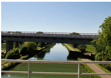
L'A355 se caractérise par une densité élevée d'ouvrages d'art. Ici un exemple de franchissement de canal.