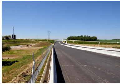
Vue d'ensemble d'un tronçon achevé du chantier de contournement de Strasbourg.

Le très vaste chantier du contournement ouest de Strasbourg (COS) met à l'honneur deux techniques : le traitement en place des sols, composés essentiellement de loëss et de lehms, et l'utilisation des liants hydrauliques routiers (LHR) pour le traitement de la partie supérieure des terrassements et de la couche de forme. Un liant confectionné sur mesure pour un projet hors norme, dont les enjeux sont importants pour l'agglomération de Strasbourg.