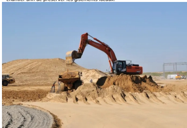
Les techniques utilisées ont permis le ré-emploi de la majorité des déblais du chantier afin de préserver les gisements locaux.