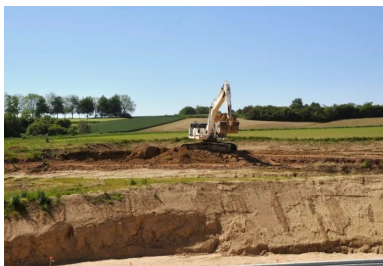
Les techniques utilisées ont permis le ré-emploi de la majorité des déblais du chantier afin de préserver les gisements locaux.