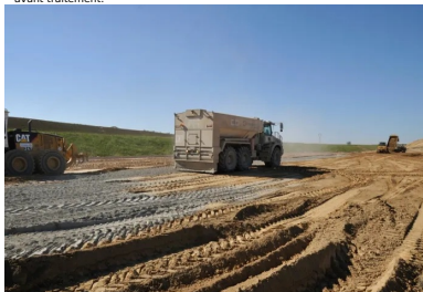
Après scarification, épandage du liant hydraulique routier.