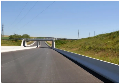
De nombreux ouvrages ont dû être installés pour permettre de maintenir une continuité écologique autour de la nouvelle route et garantir le déplacement de la faune locale.

pour les déplacements de la faune locale. Pour réduire cet impact, le concessionnaire a dû intégrer à son projet de nombreuses compensations environnementales et, notamment, la réalisation de plusieurs ponts réservés au passage de la faune ainsi qu'une centaine d'ouvrages plus petits (1 x 1 m) destinés à la petite faune afin de maintenir les continuités écologiques.