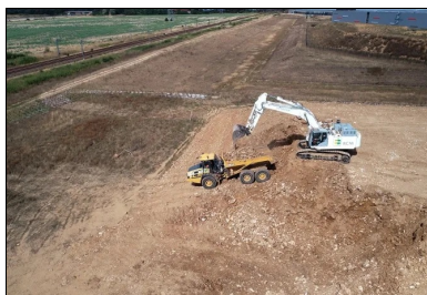
Les terrassements ont permis la réalisation d'un remblai « d'une hauteur de 7 m ».