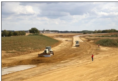
Réglage et compactage.