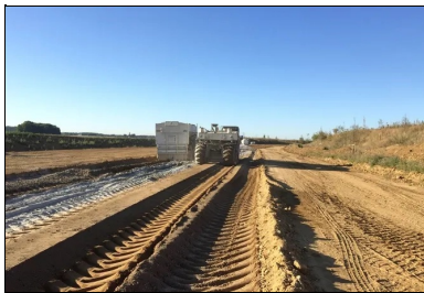
L'épandage du liant hydraulique routier ROC VDS (soit plus de 29 kg/m 2 ) à la surface du matériau à l'aide d'un épandeur à dosage asservi à l'avancement, suivi d'un malaxage à l'aide de la stabilisatrice Wirtgen 2400.

L'opération de traitement, proprement dite, y a succédé. Elle a été réalisée en deux phases successives : un épandage du liant hydraulique routier à raison de 4,75 % de ROC VDS (soit plus de 29 kg/m 2 ) à la surface du matériau à l'aide d'un épandeur à dosage asservi à l'avancement, suivi d'un malaxage à l'aide de la stabilisatrice Wirtgen 2400. « Lors du malaxage, nous ne voulions pas que des matériaux non traités restent à l'interface de la PST et de la CDF. Notre conducteur de malaxeur a donc systématiquement repris 1-2 cm du traitement de la PST pour s'assurer de la parfaite liaison des deux couches », précise Yoann Ausanneau.