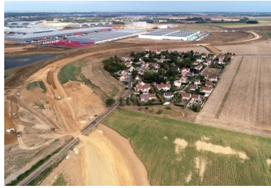
Vue aérienne du chantier du barreau sud de contournement du hameau d'Ourdy, il permettra de relier les communes de Moissy-Cramayel et de Réau à Savigny-le-Temple.

Implanté le long de l'autoroute A5, à Réau, au nord de Melun (Seine-et-Marne), le parc d'activités de l'A5-Sénart est promis à un bel avenir. Pour renforcer sa voirie de liaison, l'établissement public d'aménagement Sénart (EPA Sénart), maître d'ouvrage, a choisi, sur proposition du bureau d'études Ségic Ingénierie, la solution du traitement de sol au liant hydraulique routier (LHR), couplée avec un recyclage des matériaux pour réaliser les travaux de terrassement de la liaison Réau-Ourdy. Un chantier d'avenir, écologiquement exemplaire, réalisé par l'entreprise Routes & chantiers modernes (RCM).