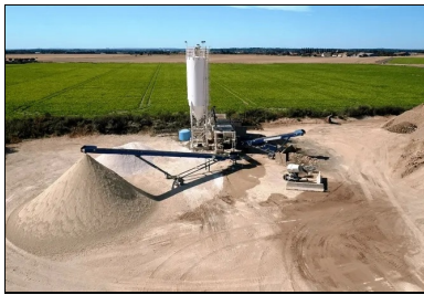
La plate-forme de revalorisation des matériaux inertes du BTP de RCM, implantée à Montereau-sur-le-Jard.