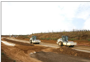
Les deux compacteurs V5 de l'atelier de compactage.