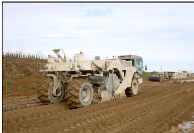
Le malaxage a été effectué à l'aide de la stabilisatrice Wirtgen 2400. Pour s'assurer de la bonne interface PST-CDF, 1-2 cm du traitement de la PST a été systématiquement repris.