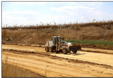
Phase très importante. La recoupe finale garantit un bon réglage.

Le traitement de la couche de forme est suivi de l'opération de compactage . L'atelier de compactage se compose de deux compacteurs vibrants V5 et d'un compacteur à pneus. Il effectue 8 passes à 2,5 km/h, travaillant en parallèle, et 6 passes de P3 sur la couche traitée, dont 2 sur l'enduit de cure .