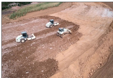
Vue d'ensemble des travaux de réalisation du remblai, par couches successives.

« 90 % du parc des machines de terrassement sont asservis GPS, 100 % des machines de réglage sont équipées en ATS (système de suivi dynamique de haute précision) », précise Roger Meschin, directeur du matériel . De son côté, Pierre Stoquet, directeur d'exploitation , ajoute : « Nos conducteurs d'engins appliquent une procédure d'entreprise pour la vérification des points de contrôle que notre géomètre-topographe enregistre à chaque début de chantier sur trois ou quatre plots disposés sur le chantier. »