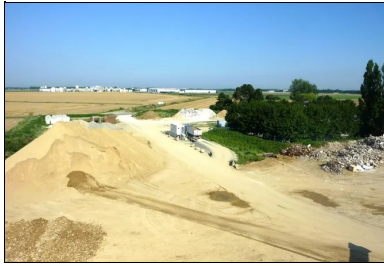
La zone de stockage de la plate-forme avec différents matériaux (sables, gravillons, déblais...).

Ensuite, pour réaliser la couche de forme, il a fallu, dans un premier temps, acheminer les matériaux recyclés et prétraités à la chaux provenant de la plate-forme de revalorisation de RCM, sise à Montereau-sur-le-Jard ; et dans un second temps, mener l'opération de mise en œuvre du matériau sur 40 cm, pour une épaisseur finale de 35 cm, afin de tenir compte du compactage et de la recoupe finale. Cette phase est très importante, car un bon réglage ne peut être garanti que s'il y a une recoupe de la couche après traitement. Aucun apport n'est possible dans la phase de réglage. « Une étape-clé a été la parfaite humification du matériau. Pour obtenir une teneur en eau optimale, nous avons employé une arroseuse à enfouissement (20 l/m 2 ), puis réalisé un malaxage d'homogénéisation au malaxeur , et ce préalablement aux opérations de traitement de la couche », explique Laurent Simon.