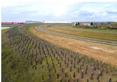
La nouvelle voie a été ouverte à la circulation en mars 2021. Ses aménagements paysagers permettent au nouveau tronçon de se fondre harmonieusement dans le paysage local.