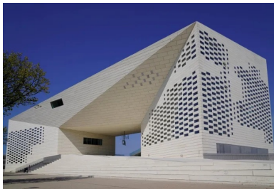
La Méca, Bordeaux. Archi. : Bjarke Ingels

Mobilisation, investissements et projets de l'Industrie Cimentière pour décarboner et permettre d'atteindre la neutralité carbone en 2050. Conférence de presse du 26/05/21 - Paris