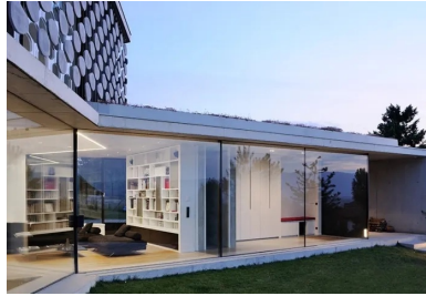
De généreuses baies vitrées ouvrent la maison sur les jardins et les vues lointaines.

La maison sous la falaise se situe en Haute-Savoie, dans un site exceptionnel. Le paysage est dominé par les parois abruptes et saillantes du Salève, tandis qu'en contrebas du versant nord de la montagne, les vues lointaines portent le regard jusqu'au lac Léman et à Genève. Ce projet est le fruit d'une étroite collaboration entre l'architecte Pierre Minassian et les futurs habitants. Prévus, lors des premières esquisses, pour une personne célibataire, la maison abrite aujourd'hui un couple et leur jeune enfant.