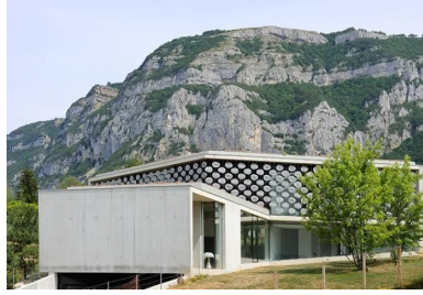
Le volume en étoile à trois branches de la maison s'inscrit dans le paysage dominé par les parois du Salève.

L'architecte Pierre Minassian a conçu ici une maison contemporaine atypique, aux lignes épurées, qui s'inscrit en toute discrétion dans le paysage.