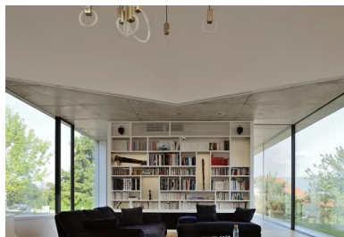
Implanté au cœur de la maison, à la croisée des trois branches de l'étoile, le salon se développe en double hauteur et offre de multiples points de vue sur le paysage.

En plan, la maison compose une étoile à trois branches. Cette figure permet la multiplication des points de vue sur le paysage spectaculaire, entraîne des jeux de lumière permanents à l'intérieur et offre une variété d'espaces et de jardins dont les occupants profitent selon l'heure de la journée.