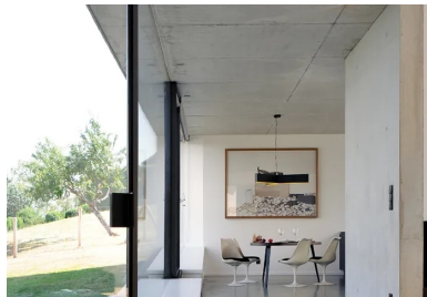
Vue sur la salle à manger depuis le salon.

La structure et l'enveloppe de la maison sont réalisées en béton gris brut . L'enchaînement des parois verticales et horizontales en béton façonne le volume de la maison et compose le rythme des opacités et des transparences.