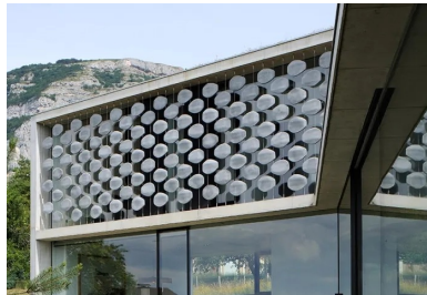
À l'étage, un moucharabieh contemporain, composé de pièces en béton fibré à ultra hautes performances (BFUP), protège l'intimité des espaces privés et réduit l'impact solaire sur les grands vitrages.

« Le propriétaire connaissait bien mon travail », explique l'architecte. « Il voulait avoir une maison à l'architecture contemporaine, comme celles que j'avais déjà réalisées. Dans les maisons que je conçois, il existe une grande fluidité spatiale à l'intérieur et les différents espaces de vie sont ouverts les uns sur les autres. À l'inverse, mon client souhaitait qu'ils soient clairement séparés, voire cloisonnés comme dans une maison traditionnelle. Souvent dans nos échanges, il me citait l'une ou l'autre de mes maisons. Je me voyais dans l'obligation de lui dire ce que j'avais conçu, dans ces projets, était à l'opposé de ce qu'il désirait en termes de séparation et de cloisonnement strict des différentes parties de son programme. Autre point important, il voulait trouver des jardins différents, bénéficiant de diverses expositions solaires en fonction des heures de la journée. Dernier point, il tenait à profiter au maximum, de chez lui, des deux vues privilégiées, celle sur la falaise du Salève, ainsi que celle sur le lac Léman et Genève au loin.