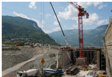
Les 9 000 m 3 des bétons de structure sont coulés en place. Le chantier dispose d'une centrale à béton principale située à Saint-Jean-de-Maurienne et d'une centrale de secours à Saint-Julien-Montdenis.

« Comme souvent lorsqu'un ouvrage est réalisé sous des infrastructures existantes, la construction de la tranchée couverte devait d'abord s'adapter à un phasage général complexe », expose Frédéric Fabre, responsable du projet pour Telt. Le trafic sur l'A43 et la RD1006 devait en effet être maintenu continuellement durant toute la durée des travaux. La première opération du chantier a donc consisté à déplacer la RD1006 et l'A43 à quelques dizaines de mètres du site du chantier, sur une plateforme temporaire le long de la rivière de l'Arc. Une fois cette lourde étape réalisée, les équipes travaux ont alors pu s'emparer du site du chantier pour réaliser la fouille à l'intérieur de laquelle serait bâtie la tranchée couverte. 250 000 m 3 de déblais ont ainsi été extraits de la butte jouxtant le village de Villard-Clément.