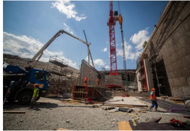
Le chantier de construction de la tranchée couverte (au centre) est réalisé à l'abri d'une paroi berlinoise (à droite).

Non loin de la frontière italienne, au cœur de la vallée de la Maurienne en Savoie, la tranchée couverte de Saint-Julien-Montdenis est la porte d'entrée du futur tunnel ferroviaire de 57,5 km qui traversera les Alpes pour relier Lyon à Turin à grande vitesse. La réalisation de cet ouvrage cadre en béton armé a nécessité le déplacement puis le rétablissement de la route départementale et de l'autoroute qu'il doit soutenir. La présence proche d'habitations a quant à elle entraîné la construction d'un soutènement vertical temporaire très technique. Le tout, en pleine crise sanitaire liée à la Covid-19. Reportage.