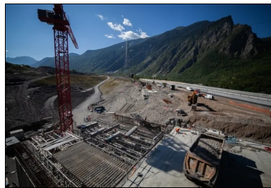
Pour pouvoir respecter le phasage de déplacement des chaussées, la tranchée couverte est construite en 4 phases.