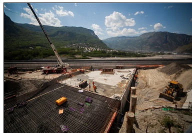
La construction de la tranchée couverte nécessite le déplacement puis le rétablissement de la RD1006 et de l'A43 (au fond).

C'est l'une des plus grandes infrastructures en cours de construction dans le monde. La future liaison ferroviaire de 270 km entre Lyon et Turin est un projet au long cours dont la section transfrontalière comprend le tunnel bitube de base du Mont-Cenis, d'une longueur record de 57,5 km (voir encadré 1). Pour anticiper le percement de cet ouvrage souterrain majeur, son maître d'ouvrage binational Telt (Tunnel Eurpalin Lyon Turin) aménage actuellement les sections d'approche dans la vallée de la Maurienne. Sur le site de Saint-Jean-de-Maurienne en Savoie, plusieurs lots de travaux sont ainsi en construction : des digues en rive gauche de la rivière de l'Arc, des ouvrages de génie civil en gare de Saint-Jean-de-Maurienne et la tranchée couverte de Saint-Julien-Montdenis. Cette dernière, qui raccordera l'entrée du tunnel de base côté français, permettra le passage des voies ferrées de la future ligne sous l'autoroute A43 et la route départementale 1006.