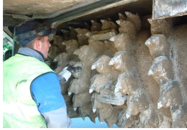
Détail du rotor du malaxeur

Durant le mélange et si nécessaire, de l'eau peut être introduite suivant un dosage précis. De plus, plutôt que d'épandre le liant sous forme de poudre, comme décrit plus haut, une pâte liquide (coulis) formée d'eau et de ciment peut être injectée directement dans la chambre de malaxage, évitant ainsi la production de poussière. En France, des entreprises ont développé des ateliers de retraitement (ARC ou équivalent). ARC est l'acronyme d'« atelier de reconconditionnement de chaussées ». Il s'agit en effet d'un atelier intégrant toutes les opérations et pouvant les exécuter en un passage. Un des grands avantages de cette machine est la présence de deux rotors : le malaxage se fait aussi bien transversalement que verticalement, ce qui donne un produit fini particulièrement homogène.