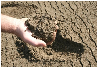
Aspect matériau après malaxage

L'objectif de cette opération est de mélanger intimement in situ et à froid les matériaux obtenus par fragmentation de l'ancienne chaussée. Ceux-ci sont éventuellement modifiés par l'ajout d'un correcteur granulométrique et humidifiés, avec le liant épandu en surface, afin d'obtenir, après prise et durcissement , un mélange homogène présentant des caractéristiques mécaniques élevées. Dans le cas où le matériau est à forte teneur en argile, le traitement au liant hydraulique est précédé par un traitement à la chaux . L'opération de traitement est conduite à l'aide d'un matériel spécifique : le malaxeur-pulvérisateur .