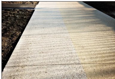
Le chantier, très linéaire a nécessité la pose de 1 800 ml de coffrage (3 x 600 ml).