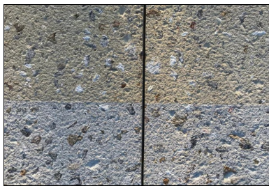
La voie piétonne (de couleur grise) et la piste cycliste (de couleur jaune).