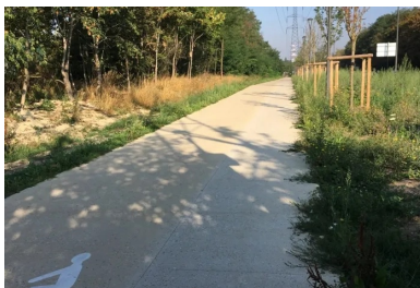
L'ouvrage a été réalisé entre deux espaces verts, à proximité immédiate de végétaux réimplantés dans une terre naturelle.

Vidéos, Guides techniques, organisation de Journées techniques, découvrez les outils mis à votre disposition sur : www.infociments.fr/routes/