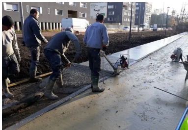
Le tirage du béton au rouleau Striker. Il n'a pas été vibré pour ne pas faire descendre le granulat, qui doit rester en surface pour le bon aspect visuel de la finition piquée.

Note de calcul des joints de dilatation Lire la suite