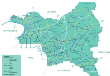
La carte des pistes cyclables existantes et en cours de réalisation en Seine-Saint-Denis.

En 2019, dans le cadre du Plan Mobilité durable du département, 21 km de pistes cyclables avaient déjà vu le jour dans le 93. Début 2020, un autre projet a été réalisé à Aulnay-sous-Bois, le long de l'avenue Suzanne-Lenglen. Un choix logique pour une ville qui a manifesté très tôt son intérêt pour ce mode de locomotion, puisqu'elle s'est dotée d'un schéma directeur des itinéraires cyclables dès 2012.