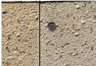
Les joints de retrait-flexion ont été réalisés le lendemain du coulage par sciage sur un tiers de l'épaisseur du béton, tous les 3 ml (piste cyclable) et tous les 1,5ml (voie piétonne).

Des joints de retrait-flexion ont été réalisés le lendemain du coulage par sciage sur un tiers de l'épaisseur du béton, tous les 3 ml (piste cyclable) et 1,5 ml (voie piétonne). Pour ne pas épauprer les bords, ils ont été remplis avec un coulis à prise accélérée avant la réalisation de la finition piquée. Ils ont été ensuite rouverts par sciage.