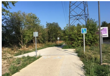
La piste cyclable réalisée début 2020 par Eurotech Floor à Aulnay-sous-Bois.

Soucieux de développer les « mobilités douces », le département de la Seine-Saint-Denis souhaite devenir « 100 % cyclable d'ici à 2024 », année des Jeux olympiques de Paris. Il a lancé un ambitieux programme de construction, marché sur lequel les entreprises du béton décoratif sont bien placées. Exemple avec Eurotech Floor et son concept de béton « biomécanique ».