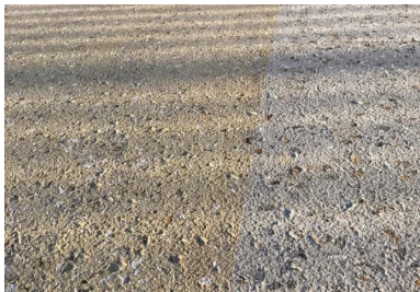
Les deux finitions de béton : ocre clair à gauche et gris clair à droite.