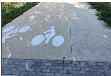
La piste cyclable et la bande piétonne ont été rapidement ouvertes à la circulation.