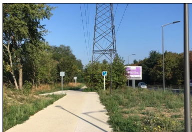
La ligne à haute tension surplombant la piste cyclable et la bande piétonne.