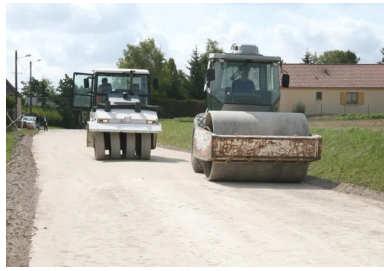
Atelier de compactage.

Le compactage est une opération qui consiste à réduire les vides contenus dans un matériau foisonné afin d'augmenter sa cohésion et par conséquent d'assurer la stabilité de l'ouvrage dans le temps. Il est réalisé soit au moyen de compacteurs statiques (à pneus ou à pieds dameurs) qui agissent uniquement par leur poids, soit à l'aide de compacteurs vibrants (à bille lisse ou à pieds dameurs) qui agissent par leur poids et par la vibration (amplitude et fréquence) qu'ils génèrent, soit au moyen des deux types de compacteurs. En fonction de la nature des matériaux et de l'objectif de compacité recherché, on détermine le type de compacteur (avec sa vitesse et le nombre de passes) et l'épaisseur maximale de la couche à compacter.