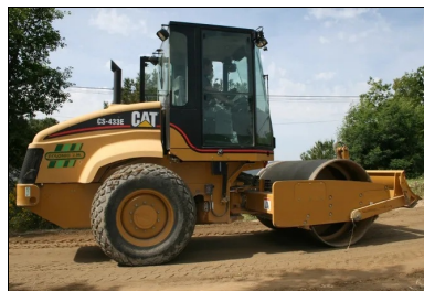
Compactage au rouleau vibrant.

On distingue classiquement 5 objectifs de compactage des matériaux :