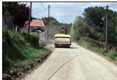
Compactage au rouleau vibrant.