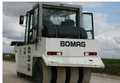
Compacteur à pneus en action.