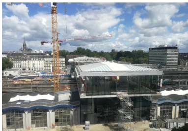
La gare-pont s'apparente à une grande rue qui franchit les voies ferrées pour relier le quartier historique au nouveau quartier d'affaires.

« Il présente d'indéniables aménités en termes d'usage, de surfaces supplémentaires, de rationalité structurelle, de logique économique et de maîtrise financière. » En effet, cette solution offre quelque 4 000 m 2 supplémentaires, dont 2 200 m 2 d'espaces de transit et 1 500 m 2 de commerces. Mieux qu'un simple trait d'union, l'ouvrage s'apparente à une grande rue perchée à 10 m du sol. Cet espace, éminemment spacieux et lumineux, offre des vues panoramiques sur le canal Saint-Félix, la ville et le paysage ferroviaire. Mariant les flux voyageurs, l'activité commerciale et la vie urbaine, il rappelle la salle des pas perdus des grandes gares classiques. À cela s'ajoute une gestion évidente des flux : « Des porte-à-faux en béton signalent les entrées de la gare », précise Catherine Malleret. « À l'intérieur, les circulations verticales sont implantées frontalement et immédiatement visibles. Le maître d'ouvrage a apprécié cette disposition qui facilite les mouvements. »