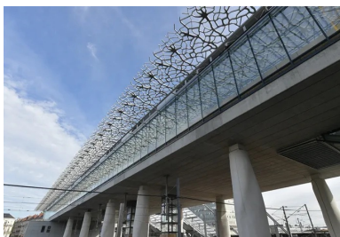
Les baies vitrées sont protégées des apports solaires par des ombrières en BFUP.

Inspirée de formes arborescentes, la structure porteuse en béton s'élève sur deux niveaux. La première structure, porte le tablier de la mezzanine à 10 m de haut, il s'agit de 18 piles géantes en béton dont la forme organique s'apparente à des troncs enracinés par un réseau de 360 micropieux, dont certains descendent à 25 m de profondeur. Pour la deuxième, au niveau de la mezzanine, les troncs se transforment en une allée d'arbres en béton dont les branches déploient une charpente triangulée qui porte la couverture. En guise de canopée, des ombrières se déploient en porte-à-faux pour protéger du soleil les façades vitrées. Les « troncs » sont en béton blanc, le tablier en béton armé, les « arbres » en métal habillé de béton projeté et les fines membrures de l'ombrière en Béton Fibré à Ultra Hautes Performances (BFUP), matériau d'élection de Rudy Ricciotti. « Le béton est beaucoup plus performant que l'acier ou l'aluminium », insiste le célèbre architecte. « C'est un matériau à empreinte écologique faible, n'en déplaçant aux écologistes obtus. Et puis, ce n'est pas délocalisable : ces bâtiments donnent du travail à beaucoup d'ouvriers sur place. Réduire le besoin de main d'œuvre, c'est aussi réduire l'énergie architecturale. »