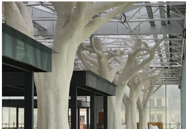
À 10 m du sol, la couverture de la mezzanine est portée par une allée d'arbres en béton projeté.

La nouvelle gare de Nantes franchit le faisceau ferroviaire au moyen d'une rue aérienne bordée d'arbres en béton qui relie le centre historique au quartier d'affaires EuroNantes au sud.