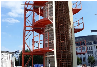
Les piles en béton blanc autoplaçant coulé en place portent la mezzanine.