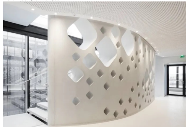
L'escalier offre des parcours à la lumière du jour qui incitent à l'emprunter.