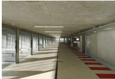
Les plateaux de stationnement sont lumineux et ventilés naturellement.