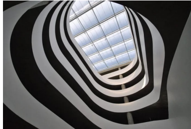
La rampe en double hélice se développe dans le vide central. Le mouvement cinétique de ses lignes et de ses courbes en béton met en scène le déplacement des véhicules entre les niveaux de stationnement.