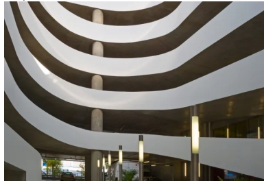
La rampe en double hélice se développe dans le vide central. Le mouvement cinétique de ses lignes et de ses courbes en béton met en scène le déplacement des véhicules entre les niveaux de stationnement.