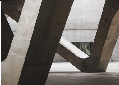
Réparation et renforcement des structures en béton au moyen de matériaux composites

Si les désordres de la partie d'ouvrage en béton sont superficiels et si les armatures ne sont pas corrodées, l'opération de réparation comprend :