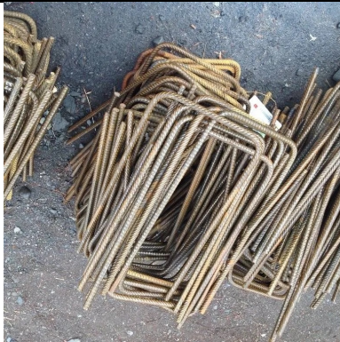
Réparation et renforcement des structures par des armatures passives additionnelles