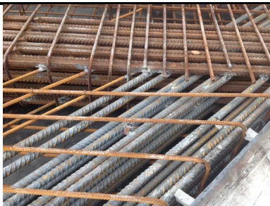
Réparation des ouvrages en béton armé dégradés par corrosion des armatures