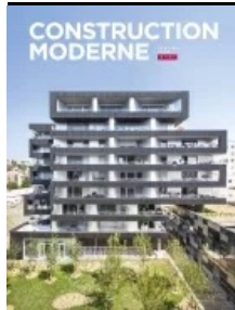
Cet article est extrait de Construction Moderne n°161

Maître d'ouvrage : CCI Nice-Côte d'Azur ; ville de Cannes ; conseil départemental des Alpes-Maritimes ; communauté de communes – AMO maîtrise d'œuvre urbaine, architecte et paysagiste : Jean-Louis Durochat (Archipay) – Maîtrise d'œuvre : Egis – Entreprises : groupement associant TP Spada, mandataire ; Jean Negri & Fils, Razel Bec et Campenon Bernard TP Côte d'Azur.