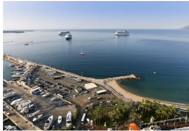
Les digues du Vieux-Port de Cannes se divisent en plusieurs sections.