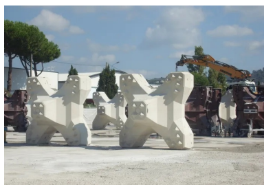
Les ACCROPODE (TM) II sont des blocs en béton coulés en une fois dans des moules spécifiques. Ils sont dotés de protubérances tronconiques qui optimisent l'accrochage des éléments entre eux et permettent d'augmenter la pente d'une digue à talus.

Le confortement des digues est réalisé par un groupement d'entreprises qui mettent en commun leur expertise et leurs moyens pour assurer les travaux maritimes, le génie civil, l'insertion des réseaux et la préfabrication des éléments en béton (ACCROPODE™ II et mur chasse-mer). Les travaux se sont déroulés d'octobre 2018 à avril 2019 par voie terrestre, le parking Laubeuf servant de plateforme de chantier. L'exiguïté à l'extrémité de la digue n'a pas simplifié les conditions de réalisation et a nécessité la construction d'ouvrages temporaires. La cinématique fut structurée en trois étapes, à commencer par la dépose d'une sous-couche d'enrochements (200 cubes en béton) et d'enrochements naturels (10 000 m 3 ) en pied de l'ouvrage. La deuxième étape fut de reconfigurer le profil de la digue avec la mise en place de 1 179 ACCROPODE™ II dont la forme, le volume (4 m 3 ) et le poids (9,6 t) rendent la carapace particulièrement résistante aux assauts de la mer. Enfin, la première phase s'est terminée avec la réalisation d'une partie du mur chasse-mer.