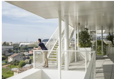
Côté jardin, au sud, les terrasses créent des lieux de travail ou de rencontre informels.

À la pureté des plans répond la sobriété des matériaux mis en œuvre. Ils se limitent au béton , au verre des menuiseries et à l'acier blanc des garde-corps, à l'extérieur ; à de l'espace, de l'air et de la lumière pour ce qui concerne l'intérieur. Économie de moyens ou influence de la récente collaboration des deux concepteurs avec l'architecte japonais Sou Fujimoto pour le projet de l'arbre blanc à Montpellier ?