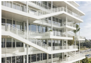
Au sud, des escaliers assurent des liaisons directes entre les différents niveaux pour les entreprises qui en occupent plusieurs.

Cette frugalité s'étend également à l'aspect énergétique du projet. Le suivi des consommations depuis la livraison du bâtiment en janvier 2019 montre 30 % de dépense énergétique en moins que celle de bureaux classiques.