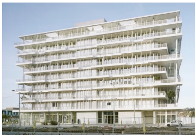
La longueur des débords s'adapte aux orientations. elle est réduite au nord, où un jeu aléatoire de poteaux crée une façade vibrante le long de la nouvelle avenue.

Afin de donner un usage à ces grands débords de dalle, des terrasses accessibles sont tout naturellement venues les animer pour le bien-être des travailleurs.