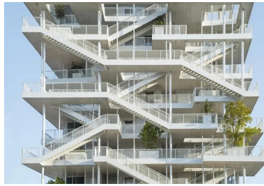
Les circulations verticales communes s'organisent sur les pignons et sont agrémentées de jardinières plantées d'arbres adultes.

apparente la sous-face de la dalle. Celle-ci est traitée en béton brut apparent. La présence intérieure du béton renforce l'inertie du bâtiment et participe au bon confort thermique intérieur.