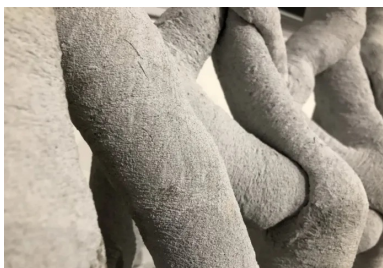
Béton extrudé dans une matrice de gel réutilisable - Soliquid

En France, les compositions de béton utilisées pour les applications industrielles sont en général des pré-mix développés par les cimenteries et les adjuvantiers pour répondre aux spécificités du procédé. En jouant sur l'accélération réalisée dans la tête d'impression ou sur la nature des adjuvants utilisés, le degré de complexité des pièces imprimées peut être renforcé, et surtout, le risque d'affaissement, principale difficulté du procédé 3D, est limité.