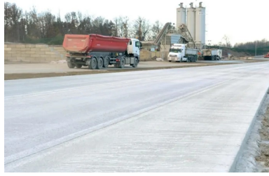
Le BAC recouvert d'un produit de cure. En médaillon : les amorces de fissuration réalisées dans les vingt-quatre heures après bétonnage.

« L'appel d'offres portait sur la réalisation d'une structure rigide pour un trafic de 17 000 véhicules/jour (dont 20 % de PL) et sur sa maintenance, avec la possibilité pour les entreprises d'introduire des variantes, détaille le directeur des routes de la province de Namur, Didier Masset. L'analyse du coût global (construction et entretien) sur une période de service de cinquante ans a conforté l'intérêt du choix d'une chaussée bicouche en béton armé continu. » L'entreprise TRBA a été chargée du chantier.