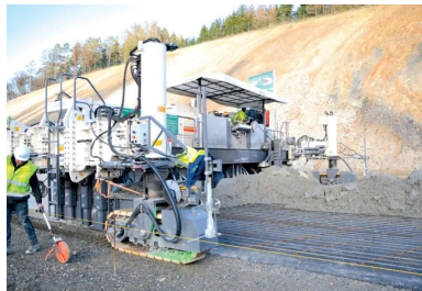
Assurant en une seule opération le coffrage et la vibration, la première machine à coffrages glissants (Wirtgen SP 1500) bétonne sur 17 cm d'épaisseur et sur 10 m de largeur. Au premier plan, le fil de guidage.

Au total, ce sont environ 300 000 m 2 de BAC bicouche qui ont été mis en œuvre sur 2 x 2 voies (+BAU) et sur une longueur de 14 km.