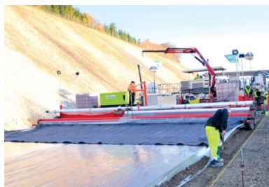
Après la pulvérisation d'un retardateur de surface, le revêtement est recouvert d'un film en polyéthylène.

Un an après, Routes était de retour outre-Quiévrain pour visiter le chantier d'une autre réalisation spectaculaire : le contournement de la commune de Couvin, réalisé également en BAC, mais cette fois en bicouche, frais sur frais. Au sud de la Belgique, la commune de Couvin se situe à l'extrême sud-ouest de la province de Namur. Le territoire de la commune jouxte la frontière française. Il s'agit de la plus vaste commune de Belgique après Tournai.