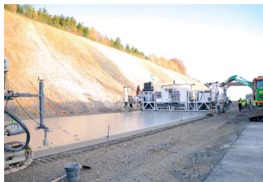
La seconde machine à coffrages glissants suit la première à une distance de 20 m. Elle met en œuvre la couche supérieure du BAC, frais sur frais, sur une épaisseur de 6 cm.

Le directeur technique de TRBA ne cache pas son enthousiasme pour les autoroutes en BAC et pour cette nouvelle réalisation. « En Belgique, une autoroute en béton est aussi confortable qu'une autoroute en asphalte, se félicite Filip Covemaeker. Avantages : un confort de roulement excellent, peu de bruit, une planéité parfaite et une rugosité qui n'évolue pas au fil du temps. »