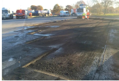
Le béton a été mis en œuvre sur 10 cm d'épaisseur et vibré à l'aide d'aiguilles vibrantes et d'une règle vibrante.

GTM Travaux spéciaux est choisie pour la réalisation du BCMC.