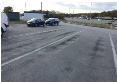
Les aires de stationnement en enrobé bitumineux sont sujettes à des déformations, notamment à un important orniérage et à du « fluage », ce qui impose un entretien répétitif.