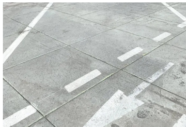
Le calepinage des sciages a été réalisé selon un quadrillage de 1,20 x 1,20 m. Total : 2 100 mètres linéaires.

« Nous devons absolument obtenir une résistance mécanique en compression de 25 MPa à 48 heures. Elle avait été demandée par le maître d'ouvrage pour des impératifs de remise en service des aires de stationnement PL. Cela a bien été le cas. Nous étions même au-delà ! » se félicite Aurélien Fresneau.