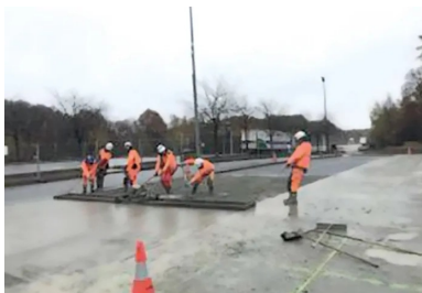
L'ancien enrobé orniéré a été raboté sur une épaisseur de 10 cm. Durée d'intervention pour respecter le planning : une journée.