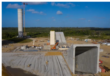
Le béton des carreaux est formulé pour pouvoir résister à des conditions extrêmes.

D'une masse totale de 46 t, ce plateau coffrant couvrait une surface de 200 m 2 . « Chaque radier était bétonné en dix phases de 7,7 m de longueur », précise Frédéric Cuffel. Les voiles ont quant à eux été coulés via deux coffrages grimpants d'une masse unitaire de 25 t, permettant de réaliser des portions de voile de 5,8 m de hauteur et 12 m de longueur d'une seule traite. Enfin, les dalles supérieures des carreaux ont été réalisées grâce à deux tables coffrantes de 120 t à peau métallique, montées sur une structure tubulaire ripée sur rails.