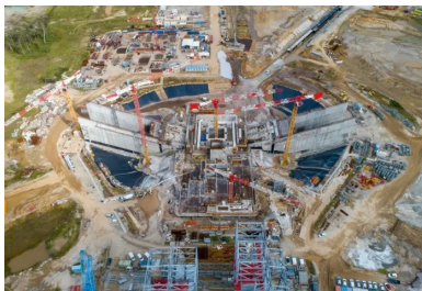
Le massif de lancement est le cœur battant d'ELA 4, c'est sur cet ouvrage semi-enterré en béton armé que s'appuiera le lanceur pour décoller.

À nouvelle fusée, nouvelle base de lancement. Baptisé ELA 4 (ensemble de lancement Ariane n° 4), ce complexe géant qui s'étend sur une surface de 170 ha, équivalente à celle de 240 terrains de football, comporte un ensemble de vingt ouvrages techniques, dont le bâtiment d'assemblage du lanceur et un portique mobile de 90 m de haut. Mais le cœur battant de la base est le massif de lancement. Cet écran géant semi-enterré en béton armé (95 m de long et 60 m de large), sur lequel s'appuie la fusée pour décoller, est posé à 30 m de profondeur dans une fosse creusée dans la roche granitique.