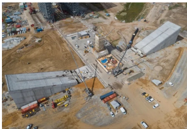
Les deux carreaux évacuent les gaz de propulsion émis lors du décollage.

Outre cette onde de chaleur, les voiles des carreaux subissent également des sollicitations dynamiques importantes générées par l'onde acoustique . « Le lanceur au moment du décollage provoque une surpression acoustique qui, bien qu'également atténuée par le déluge d'eau, se propage dans la structure et la déforme en provoquant un phénomène de battements », précise Frédéric Cuffel. Le dimensionnement des voiles a ainsi dû être réalisé à partir d'un calcul dynamique spécifique, validé par deux contre-calculs.