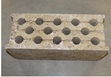
Bloc béton biosourcé