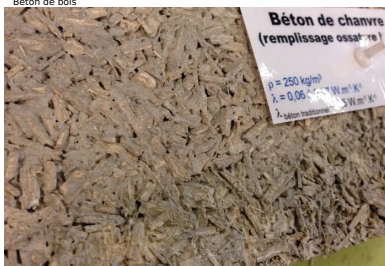
Béton de chanvre