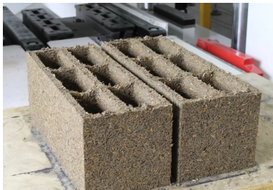
Bloc béton de miscanthus