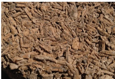
Béton de bois

Pour en savoir plus, lire l'article « Bétons biosourcés : composants, formulations et usages »