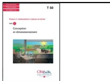
Cet article est extrait de T50. Voiries et aménagements urbains en béton (Tome 1) - Conception et dimensionnement