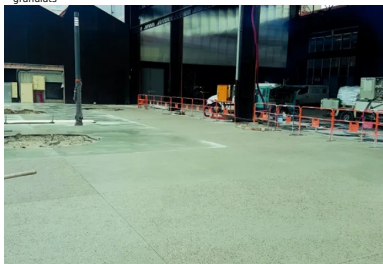
Le nouveau revêtement a une « apparence assez brute, de couleur grise, avec des agrégats roulés visibles, allant de l'ocre au noir. Il assure un bon confort de marche et une bonne adhérence. »

Maîtrise d'ouvrage : SPL Lyon Confluence - Maîtrise d'œuvre : Espaces publics du Champ : Base (paysagiste mandataire), Arcadis, Bruit du frigo, On, EODD ; Espaces publics du quartier du Marché : Atelier Ruelle, Artelia - Mise en œuvre du béton recyclé : Sols Confluence - Fournisseur du béton : Béton Vicat - Fournisseur des granulats : Granulats Vicat - Fournisseur du ciment : Ciment Vicat