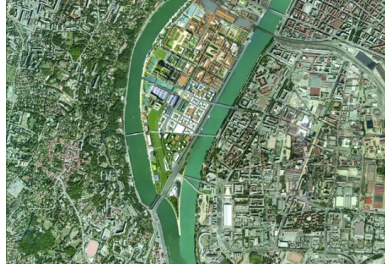
Le nouveau quartier Confluence se situe dans le prolongement du cœur de Lyon, derrière Perrache (III e arrondissement), entre Rhône et Saône.

Les chantiers de dépollution, menés à grande échelle, constituent également la marque du nouveau territoire. Pour la première phase des réalisations, pas moins de 250 000 tonnes de terre ont été extraites et dépolluées dans un centre de traitement. Choisi pour réaliser les espaces publics du Champ, le béton y joue un rôle bien spécifique, au diapason des exigences environnementales.