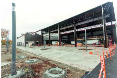
La première mise en œuvre du béton 100 % à base de granulats recyclés a été réalisée par Sols Confluence sur les abords de la nouvelle halle Girard, alias H7-Lyon French Tech. Elle a eu lieu à partir du 14 novembre 2018, en cinq jours de coulage, à raison de 20 à 30 m 3 quotidiens pour une équipe de 3 à 5 personnes, « directement à la toupette et au dumper »

« Il s'agit d'une première en France, concluent avec satisfaction Jeanne Souvent (agence Base), Nicolas Brasier (Vicat) et Sébastien Thiercé (Sols Confluence). Le nouveau quartier de Lyon Confluence est le lieu idéal pour mener ce type d'expérimentation et pour ouvrir la voie à un béton recyclé aisément utilisable en revêtement de sol, tout en gardant un caractère et une qualité esthétique indéniables. Nous sommes certains que c'est l'avenir ! »