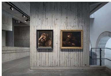
Un musée à vivre où l'on découvre les œuvres au fil des parcours proposés.

Le travail effectué sur les sources de lumière du jour met en valeur l'architecture du lieu et ses parties. La lumière naturelle agrément les espaces, les parcours, les articulations. Elle souligne par sa présence la muséographie et la scénographie conçues par l'architecte.