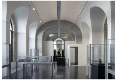
Vue sur une salle d'archéologie. La présence de la lumière naturelle et les matériaux mis en œuvre, comme le béton ciré au sol, caractérisent l'ambiance des lieux.

Après quatre années de fermeture pour travaux de rénovation, le musée des Beaux-Arts et d'Archéologie de Besançon, a rouvert ses portes le 16 novembre 2018. Installé depuis 1843 dans la nouvelle halle aux grains, conçue par l'architecte Pierre Marnotte (1797-1882). Il a fait l'objet d'une importante réhabilitation dirigée par l'architecte Adelfo Scaranello. Les collections d'art et d'archéologie cohabitent avec les activités commerciales de la halle, jusqu'en 1883, où le musée prend possession de la totalité du bâtiment.