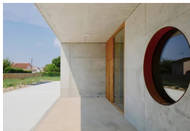
Côté rue, le volume se creuse et le débordement de toiture qui en résulte signale l'entrée de l'équipement.