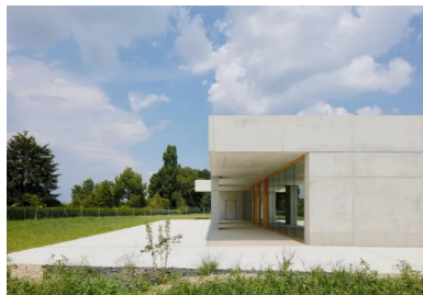
Le volume se creuse pour aménager des lieux de vie extérieurs protégés du soleil et des intempéries par les avancées de toiture.

Pour éviter aux enfants de l'école Roger Balan de devoir traverser la ville afin de rejoindre les locaux des activités périscolaires et la cantine, la ville de Saint-Marcel, voisine de Chalon-sur-Saône, a fait construire un nouvel équipement destiné à remédier à cette situation. Ce nouvel édifice abrite deux ateliers pour l'accueil périscolaire et un restaurant scolaire destinés aux enfants de maternelle et d'élémentaire de l'école Roger Balan située en face, de l'autre côté de la rue de Breuil.