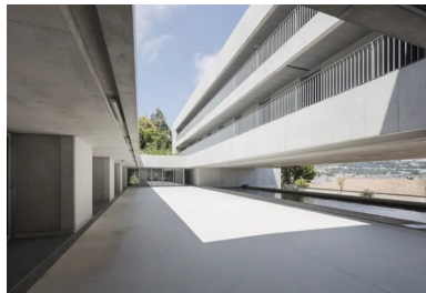
La cour centrale réinterprète l'idée d'un patio ouvert, d'un côté vers la baie de Villefranche et de l'autre vers la colline et sa verdure.