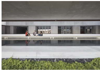
Le bassin crée une centralité particulièrement agréable pour les usagers.

Semi-enterré et à flanc de colline, le bâtiment bénéficie d'une forte inertie, qui est également renforcée par un principe constructif de double mur coulé en place avec isolant intégré. Les dalles en béton brut participent à la qualité environnementale grâce à leur inertie.