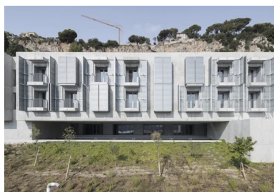
Réinterprétant l'archétype des persiennes, les balcons sont protégés par des volets métalliques qui protègent du soleil tout en créant des brise-vue entre balcons.

Les toitures-terrasses végétalisées renforcent également celle-ci, permettant un rafraîchissement par évapotranspiration des végétaux et une meilleure rétention d'eau en cas de fortes pluies. Enfin, pour parfaire cette conception bioclimatique et profiter de la proximité de la mer, une géothermie va prochainement être mise en place. Deux pompes à chaleur sur eau de mer vont permettre d'assurer la totalité des besoins de chauffage, mais aussi de rafraîchissement de la résidence au travers des planchers chauffants/rafraîchissants. L'eau chaude sanitaire est quant à elle produite par panneaux solaires , permettant d'économiser 5 448 kg de CO 2 par an.