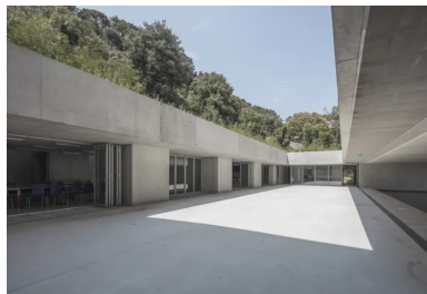
autour du patio, les salles communes possèdent des baies totalement escamotables pour gommer la limite entre l'intérieur et l'extérieur.

En balcon au-dessus du patio, des coursives extérieures distribuent l'équerre des chambres des chercheurs qui se développent sur deux niveaux. Ces circulations d'accès aux chambres extérieures autorisées par les conditions météorologiques particulièrement favorables sur la Côte d'Azur réduisent les coûts d'entretien et de fonctionnement du bâtiment en évitant toute consommation d'énergie liée au renouvellement d'air, au chauffage ou au rafraîchissement.