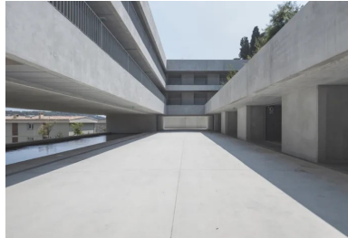
La cour centrale réinterprète l'idée d'un patio ouvert, d'un côté vers la baie de Villefranche et de l'autre vers la colline et sa verdure.

Le centre d'hébergement nouvellement réalisé par l'agence CAB occupe un site enclavé à l'arrière d'un bâtiment de recherche, sous la basse corniche qui relie Nice à Monaco, au pied de la falaise calcaire. Pour « dégager le terrain » et aller chercher la vue, les architectes ont souhaité gagner de la hauteur. La justesse du calage altimétrique a été un des principaux enjeux du projet. Il s'agissait de profiter de la pente du terrain pour trouver le niveau d'implantation qui permettrait à la vue d'échapper aux toitures du bâtiment aval. Pour ce faire, les concepteurs ont pris le parti de rassembler sur les deux premiers niveaux les locaux techniques et de service ainsi que les stationnements et les laboratoires.