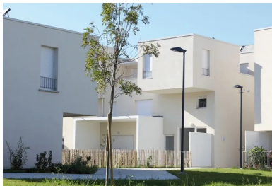
L'écriture architecturale contemporaine sort le « lotissement » de son carcan régionaliste.

En plus de ces contraintes purement architecturales, une réflexion sur les accès aux immeubles aboutit à l'élimination des parties communes : chaque logement est doté d'un accès privé, situé au premier niveau de tous les bâtiments. Les appartements sont desservis par des coursives extérieures situées au nord. Ils sont tous en duplex, et distribués soit par le haut soit par le bas. Les ascenseurs, disposés dans des tourelles, sont reliés aux coursives par des passerelles. Ce système de circulation crée légèreté et transparence par le biais de failles séparant les immeubles, en générant des perspectives inattendues. L'objectif des architectes est de proposer une image contemporaine du lotissement et de reconstituer la qualité urbaine d'un faubourg comprenant une certaine densité sans interdire la convivialité.