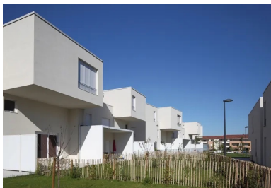
Appartements et villas sont tous dotés d'un espace extérieur, patio, terrasse, balcon ou jardin.