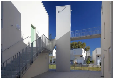
Les logements sont desservis par des coursives extérieures situées au niveau 1.

En plus de ces contraintes purement architecturales, une réflexion sur les accès aux immeubles aboutit à l'élimination des parties communes : chaque logement est doté d'un accès privé, situé au premier niveau de tous les bâtiments. Les appartements sont desservis par des coursives extérieures situées au nord. Ils sont tous en duplex, et distribués soit par le haut soit par le bas. Les ascenseurs, disposés dans des tourelles, sont reliés aux coursives par des passerelles. Ce système de circulation crée légèreté et transparence par le biais de failles séparant les immeubles, en générant des perspectives inattendues. L'objectif des architectes est de proposer une image contemporaine du lotissement et de reconstituer la qualité urbaine d'un faubourg comprenant une certaine densité sans interdire la convivialité.