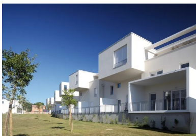
Tous les logements ont une vue sur l'espace vert central.