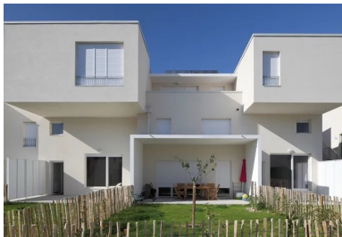
Chaque unité d'habitation comprend 2 appartements en duplex.

Et ils ajoutent : « Après avoir tâtonné pendant plus d'un an, nous avons finalement trouvé la solution. La meilleure ! Nous sommes ressortis "exsangues" de cette phase de travail, mais vraiment enrichis du contact entre les uns et les autres ! Ce sont ces relations fortes qui nous ont également permis de passer d'une démarche associative à une démarche plus opérationnelle et commerciale... »