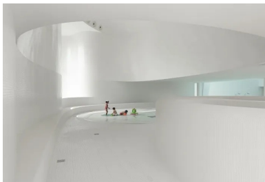
Vue sur la pataugeoire

Les parcours sont fluides, les courbes remplacent l'angle droit. L'espace de distribution est noyé dans une lumière aquatique étrange. Un hublot horizontal, au fond de la pataugeoire des petits, y diffuse une lumière bleutée qui ondule au gré de l'eau. Dans la salle de repos en double hauteur, les formes courbes englobent l'espace. Une belle fenêtre arrondie cadre sur un jardin.