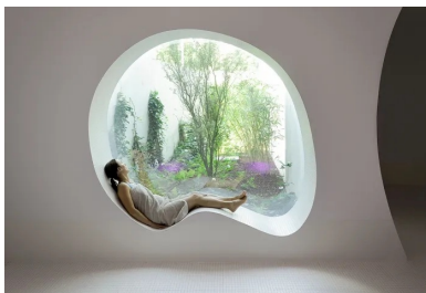
Fenêtre arrondie ouverte sur un jardin.

L'architecture de la grande salle existante, où sont situés les deux bassins, est préservée. La structure inclinée est mise en valeur et accompagnée par un jeu d'obliques qui apporte une touche contemporaine. La pataugeoire des petits offre un cocon où les enfants se sentent enveloppés. L'espace est courbe, atténuant naturellement la réverbération des sons. La grande baie en hauteur inonde de soleil le petit bassin arrondi. Ce lieu est conçu pour marquer l'imaginaire des enfants. La grande terrasse extérieure est traitée comme une plage. Ses garde-corps hauts assurent l'intimité des baigneurs.