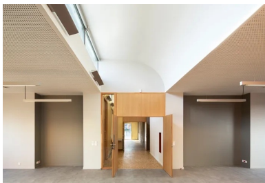
Les locaux du siège social riment avec lumière naturelle et volumes généreux.

Le bâtiment isolé par l'intérieur répond à la RT 2012, grâce à la gestion des ponts thermiques et l'utilisation de rupteurs. En termes de gestion et d'économie d'énergie, des panneaux solaires ont été installés sur la toiture-terrasse des logements, invisibles depuis les immeubles voisins, tous plus bas. Destinés à l'eau chaude sanitaire, ils servent d'alternative au système de chauffage général lorsque l'ensoleillement le permet. Les toitures-terrasses du siège social ont été végétalisées pour à la fois retenir une partie des eaux de pluie et offrir une vue agréable aux occupants des logements. Et si la qualité des vues fut un des moteurs du projet, les apports en lumière naturelle en sont un autre peut-être encore plus important. Au final, cet ensemble de bâtiments affirme avec justesse sa présence et sa singularité le long de l'avenue du Bois du Coq, tel le chaînon manquant enfin retrouvé qui affiche sans emphase sa belle modernité.