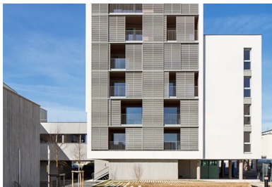
Les volets persiennés coulissants des loggias protègent du soleil et des vues.

Qualité des matériaux, acoustique de très grande qualité, volumes bien proportionnés et lumière travaillée en font des espaces confortables et enveloppants, à l'instar des circulations déclinées dans des teintes chaudes en contraste avec les vues sur l'extérieur – un parti que résume parfaitement Emmanuelle Colboc : « Toute la rugosité souhaitée à l'extérieur se transforme en douceur habitée à l'intérieur. »