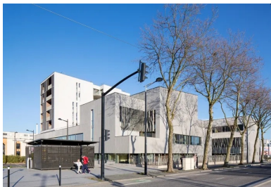
À l'arrière du du siège social, le bâtiment des logements, protégé des nuisances sonores de l'avenue.

Pour ce faire, l'agence Emmanuelle Colboc a fait appel à un consultant spécialisé qui a déconseillé l'emploi d'un béton autoplaçant, à priori idéal dans le cas de banches de grande hauteur et de ferrillages importants, au profit d'un béton fluide de type S4 compte tenu d'un climat local très agressif. Les architectes ont donc cherché avec l'entreprise une solution satisfaisante pour obtenir une surface d'apparence la plus monolithique possible. Ce qui apparaît intéressant et important relève ici plus du travail d'équipe, du lien qui s'est tissé entre le maître d'œuvre et l'entreprise pour tenter d'aboutir au meilleur résultat possible et obtenir des parois en béton brut de qualité.