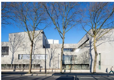
Un volume tout en béton sculpté pour laisser entrer l'air et la lumière sans en dévoiler son échelle réelle

Ses premières esquisses du siège social en témoignent et dévoilent fidèlement la structure finale du projet. Elles dessinent un volume chahuté, mais dans l'orthogonalité, fait de pleins et de vides, qui est à même de conserver un certain mystère quant à sa structure et ne donne pas à lire, dès le premier regard, le nombre de niveaux qui le composent. Pour donner corps à ce rocher, le béton s'est imposé à Emmanuelle Colboc, pour la rugosité de surface qu'il permet et pour la massivité qu'il peut dégager. Il s'agit ici d'un béton brut matricié façon coffrage à la planche. L'un, à planches serrées, symbolise le socle du rocher par la création d'un soubassement de 2 m de haut ; l'autre, plus « sage », à planches plus larges, sert aux parties supérieures des façades.