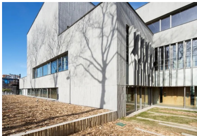
Un volume chahuté à l'instar des anfractuosités d'un rocher.

À ce rocher à l'horizontale, accueillant le siège social, viennent s'ajouter 22 logements réunis dans une petite tour en R+7 occupant l'angle nord du site. Même si l'accès et l'organisation des logements sont totalement indépendants, les deux volumes font corps sur les premiers niveaux et s'articulent autour d'un parking extérieur installé au cœur de la parcelle. Situé en décaissé par rapport au niveau 0, le parking se fait ainsi plus discret pour les occupants des bureaux du rez-de-chaussée. Côté logements, la recherche d'un habitat de qualité prime encore plus largement. Les appartements sont baignés de lumière naturelle et les volumes imbriqués, pour que chaque logement puisse bénéficier d'au moins deux orientations. Ici, le travail de la volumétrie, par un jeu de déboîtement et de décalage, autorise un placement des ouvertures évitant les vis-à-vis. Les habitants profitent de vues dégagées, d'espaces de vie prolongés par de belles terrasses habillées de bois et équipées de volets persiennés servant autant de protection solaire que d'occultation.