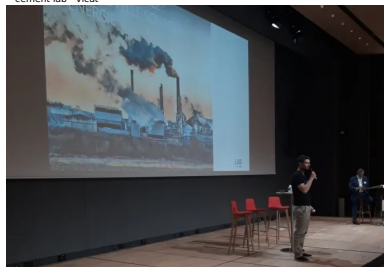
cement lab - water horizon