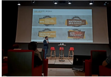
cement lab - cycle up