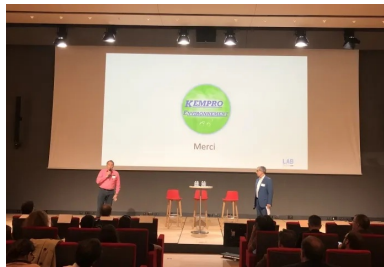
cement lab - Kempro Environment