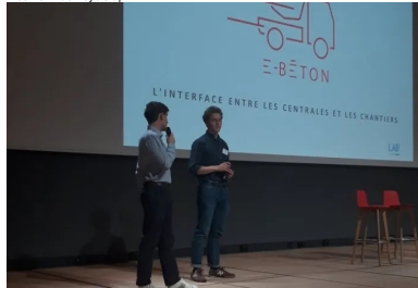
cement lab - E beton