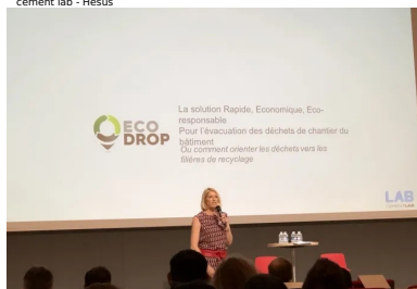
cement lab - Ecodrop