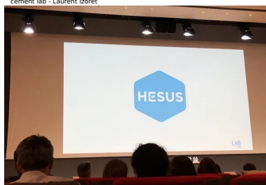
cement lab - Hesus