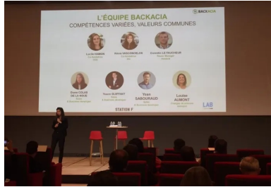
cement lab - backacia