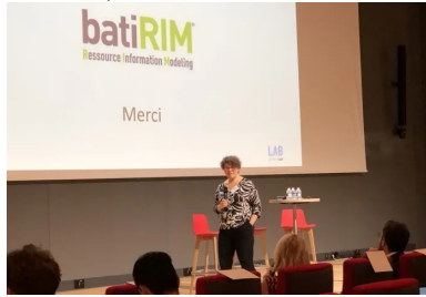
cement lab - Batirim