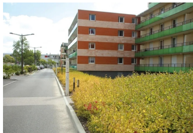
Parmi le nouveau mobilier urbain du quartier, des totems en béton blanc (préfabriqué sur mesure) marquent l'entrée de chaque immeuble.