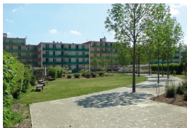
La rénovation du quartier maison Rouge a consisté à lui donner une unité, notamment grâce à des espaces verts de transition. Au premier plan, une allée en sable stabilisé d'authevernes (27) renforcé avec 5 % de ciment.

En effet, l'esprit créatif des Rondeaux a su offrir au quartier des aménagements singuliers, sources d'animation et de lien. Là, où n'existait qu'un passage ordinaire entre deux immeubles, coule désormais une fontaine en forme de ruisseau qui, la nuit tombée, se voit accompagnée par des dessins d'oiseaux projetés sur les murs. Ici, où il n'existait qu'une prairie d'herbes folles, a été organisée une aire de jeux avec table de ping-pong, One Wall (mur servant à une sorte de pelote basque qui se joue à la main), buts de foot et banquettes pour discuter. « Nous avons utilisé les deux clairières du quartier pour ajouter du mobilier et aussi des équipements sportifs. Nous avons voulu que les différents espaces s'imbriquent entre eux pour que la mixité des usages entraîne aussi celle de la fréquentation », précise Stéphane Mercier.