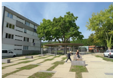
Des banquettes en béton chocolat ponctuent cet espace réalisé avec des dalles en béton coulées en place, ton pierre avec carbure de silicium désactivé, et des joints en gazon.

Certains immeubles furent voués à la destruction (deux doivent encore l'être) et tout fut redessiné à partir de ceux demeurés en place. Il a fallu créer des cheminements, réaliser des trottoirs, délimiter des espaces verts, aménager des aires de jeux, installer des totems, des murets, du mobilier urbain... Peu de chantiers sont aussi diversifiés que celui-là et utilisent autant de matériaux. « Béton de sol en plusieurs tons de chocolat avec différents états de finition – brossé, squamé, poncé, lissé avec inclusion de bande en béton blanc dans les sols –, sable stabilisé blanc cassé renforcé au ciment , béton drainant teinté et poncé pour le citystade, enrochement en pierre naturelle, béton teinté noir pour la fontaine... », énumère Samuel Béard, chef de l'agence Haute-Normandie de Minéral Service.