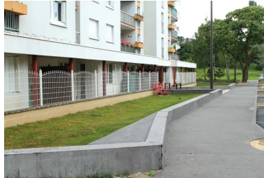
Le quartier maison Rouge dispose désormais de trottoirs en béton chocolat sablé avec liseré lisse. Les murets également en béton chocolat ont, quant à eux, une finition brossée.

Des arbres sagement alignés et des plantations bien encadrées, mais aussi des herbes folles entre des rochers, sans oublier des légumes que l'on voit poindre dans les potagers : vous êtes dans le quartier Maison Rouge à Louviers. Sur le trottoir, un élégant totem blanc ceint d'un liseré rouge indique le numéro de l'immeuble auquel il fait face. Plus loin, une fontaine coule sans précipitation tandis que des jeunes jouent au basket sur le citystade. Né en 1971 dans la périphérie ouest de la ville, ce quartier a grandi au diapason du développement économique de cette dernière avant de se dégrader au fil des ans et des vagues successives de locataires. Souhaitée dès le début des années 2000, la rénovation n'a débuté qu'en 2011. D'ores et déjà à 90 % réalisée, elle devrait se terminer en fin d'année.