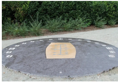
Ce cadran solaire analemmatique a été réalisé en béton chocolat et ton pierre avec des incrustations de sérigraphies métalliques.

passé. Evidemment, un tel chantier demande une véritable organisation. Pas question d'entamer des réalisations dans plusieurs endroits en même temps. Il faut pouvoir commencer et terminer une partie avant d'en entamer une autre.