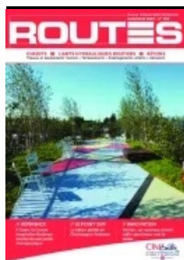
Cet article est extrait de Routes n°134

Le trafic sur les cheminements qui permettent l'accès aux vignes est important à l'époque des vendanges. À l'arrière-saison, les conditions climatiques défavorables – les précipitations notamment – peuvent les dégrader. N'étant pas destinés à un usage public, ils ont une largeur utile réduite, généralement limitée à 3 mètres.