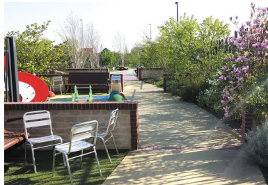
une allée centrale dessert l'ensemble du jardin pour finir dans une impasse.

Nous étions aux portes du centre hospitalier, ce qui imposait un taux de poussière égal à zéro ! Toutes les découpes ont été faites à l'eau. Nous avons également planifié les travaux pour ne pas faire de bruit durant les heures de traitement des malades. Il fallait canaliser le plus possible les nuisances. »