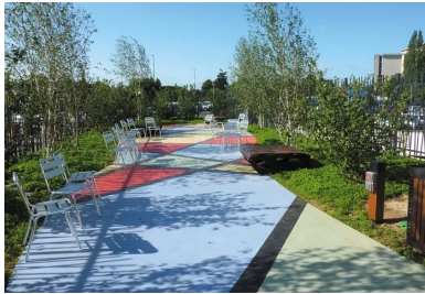
Cet espace de détente de 80 m2 en béton coloré et finement sablé arbore un arlequin rouge, noir, jaune et bleu en béton lissé, spatulé et gravé.

Couronné aux Victoires du Paysage, le jardin compte parmi les tout premiers de ce type en France.