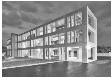
Bâtiment Aziyadé : 92 logements étudiants à La Rochelle, (MOA : CROUS de Poitiers)