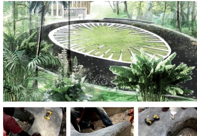
« Etoile de terre », Haïti, Port-au-Prince, 2018.

C'est une « Etoile de terre » fabriquée avec des techniques rudimentaires. Un béton « freestyle » pour une empreinte de 25 m de long qui semble émerger doucement. Telle la coupe d'un fruit ovoïde, elle est composée d'une bordure circulaire qui s'étire en excroissances ou se dissémine en petites masses isolées, comme autant de pépins convergeant vers le centre. Ces derniers, qu'on appelle sur le chantier les « bébés », ont été fait avec des moules de bois et tôle. Le béton gris enduit de blanc est une technique couramment utilisée pour délimiter les emprises végétales dans les parcs haïtiens. « Le béton permet des formes d'une souplesse invraisemblable », nous raconte volontiers Gilles Brusset. « Depuis l'utilisation que Le Corbusier a su en faire à Ronchamp, après La Grande Borne, les skate-parks et autres aires de jeux, les sculptures de Land Art de Michael Heizer, il existe de beaux exemples de figures telluriques travaillées dans la masse. » En Haïti, les formes sont arrondies à la truelle, certains moules sont en béton et le chantier est « un moment à part avec des modifications à chaque étape et des maçons ravis de faire quelque chose de beau, une œuvre magique. »