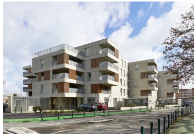
La conception en petits volumes à +4 introduit une échelle humaine au sein du quartier.

Pour saisir la teneur du projet de l'agence, il semble nécessaire de revenir un instant sur les grands principes qui régissent sa démarche architecturale