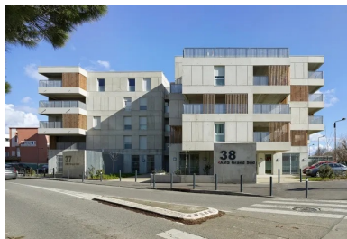
Tous les logements sont dotés de balcons ou de loggias qui forment des avancées ou des espaces en creux, créant des perspectives variées depuis la rue.

Le projet des Carrés de Bellefontaine est composé de 7 plots articulés autour d'un patio central mi-planté mi-minéral, à la manière des jardins toulousains, que l'on ne découvre qu'une fois passée la porte cochère. Ici, les petits immeubles forment une sorte de protection à l'espace central très intime de la cour intérieure.