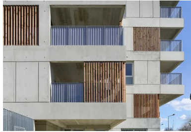
Les raccords verticaux entre les différents corps de bâtiment forment des failles en retrait jouant sur les hauteurs.