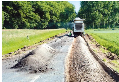
L'ancienne chaussée est un gisement de matériau qu'il est possible de valoriser

Dans ce contexte, le recyclage des chaussées en place à froid aux liants hydrauliques s'affirme comme une solution particulièrement attractive, présentant nombre de points forts décisifs : moins de déchets, moins de rotations de camions et, donc, la préservation du réseau routier avoisinant, une sécurité renforcée, une durée de travaux écourtée, la réduction des coûts, un moindre impact environnemental... La question de la connaissance des matériaux réutilisés doit toutefois faire l'objet d'une attention particulière avant la phase de déconstruction .