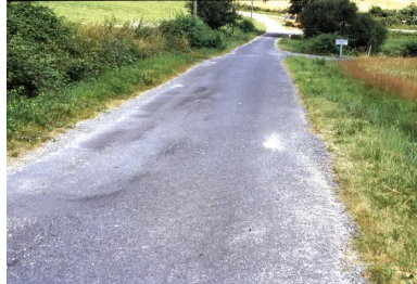
Vue générale d'une route dégradée structurellement