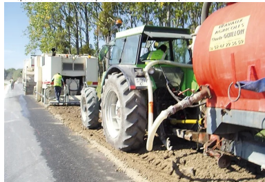
L'atelier de retraitement de chaussée réalise plusieurs opérations : fraissage, épandage et malaxage.