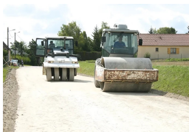
L'atelier de compactage.

Les chantiers réalisés en France, depuis une quinzaine d'années, se comportent de façon tout à fait satisfaisante grâce à la compétence de tous les acteurs : maîtres d'ouvrage, maîtres d'œuvre, entreprises et fournisseurs.