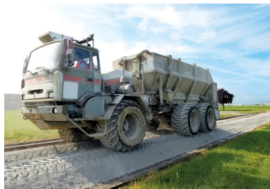
L'épandeur distribue avec précision le liant hydraulique.

Une couche de protection est ensuite appliquée sur la couche retraitée afin de la protéger des intempéries, de l'évaporation de l'eau et du trafic de chantier. Après durcissement de la couche traitée au liant hydraulique routier, une couche de surface à base de produit bitumineux est étendue afin de garantir la fonctionnalité de la chaussée.