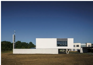
Le projet se compose de deux volumes qui jouent sur des glissements de l'un par rapport à l'autre.

L'extension s'inscrit dans la continuité du gabarit à R+1 du bâtiment existant. En plan masse, elle se dispose perpendiculairement à ce dernier, auquel elle est reliée, à l'étage, par une galerie fermée. Le premier étage est occupé par le pôle administratif et les six nouvelles classes, la galerie les relie directement à la partie déjà existante. Le CDI et la grande salle d'étude s'organisent au rez-de-chaussée.