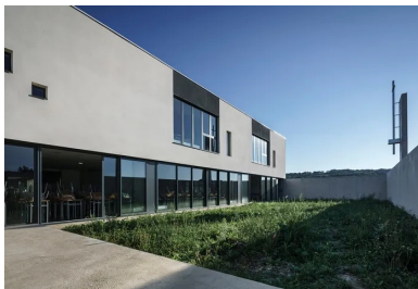
La grande salle s'ouvre sur l'espace clos de l'oratoire extérieur.

« Le projet se compose de deux volumes, l'un au rez-de-chaussée et l'autre au R+1, qui jouent sur des glissements de l'un par rapport à l'autre dans les deux directions, à la fois dans le sens perpendiculaire et dans le sens parallèle. Ce travail est souligné par les matériaux des façades. L'enveloppe du rez-de-chaussée est en béton brut de décoffrage et celle de l'étage en enduit blanc », explique Antoine Pélissier de l'agence Agapé architectes. Dans cet esprit, les deux parois latérales de la salle d'étude se prolongent vers l'extérieur et dessinent le mur de clôture de l'espace de l'oratoire extérieur qui est tenu par les lignes pures et la géométrie orthogonale des voiles de béton.